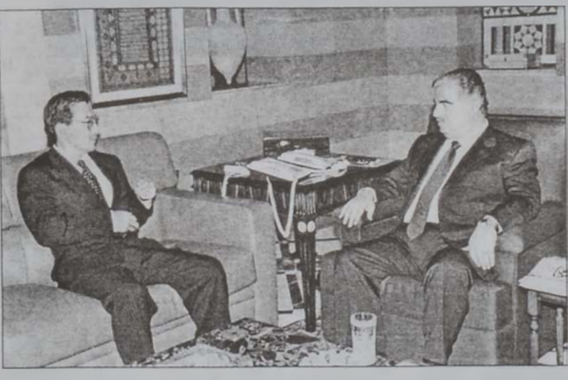
Վարչապետը կ'ընդունի Ճափոնի դեսպանը:

Ան յայտնեց, որ ժողովին պիտի ներկայացնէ համաարաբական տնտեսական գործակցութեան նոր առաջարկներ: