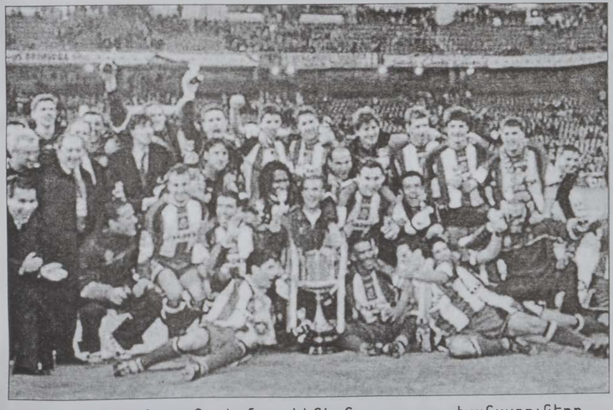
Տեփորթիւ Զորուցայի մարզիկներն ու պատասխանատուները կը տօնեն իրենց արձանագրած յաղթանակը:

Սպանիոյ ֆուրպոլի բաժակի մրցաշարքին աւարտականին (ծանօթ՝ «Թագաւորի բաժակ») անունով, երէկ, Տեփորթիւ Բորունա 2-1 արդիւնքով պարտութեան մատնեց Ռէսալ Մատրիսը՝ «Սանթիակո Պէրնայէթ»ի մէջ, 75 հազար համակիրներու ներկայութեան: Ա. կիսախաղին, Լա Բորունա 2-0 ար-