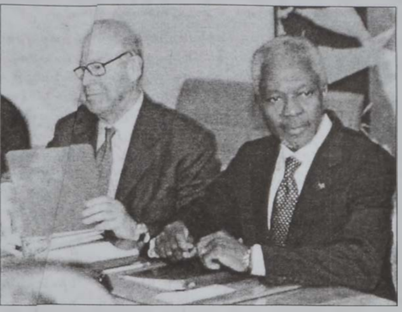
Էլեքերու քննիչ յաճճախումի ճախագահ Լաս Պիլքս' ճակից եւ Քոֆի Անան Սապրիի հետ հանդիպումից:

Շալապի ըսաւ նա- եւ, որ Անան ասկէ առաջ փորձ մը կատա- րած է եւ 1998ին Պաղ- տատի մէջ հանդի- պում ունեցած է Սատ- տամը: Օրին Անան ըսած էր, որ կա- տարելի է գործակցու- թիւնը, սակայն ոչինչ իրագործուեցաւ: Շա- լապի դիտել տուաւ, որ դիւանագիտական ու քաղաքական ճիգե- րը անօգուտ են եւ թէ ինք կը նախընտրէ պի- նուորական գործողու- թիւն մը, որ նմանի Աֆղանիստանի մէջ թալեպաններու իշ- խանութիւնը տապա- լելու գործողութեան: Շալապի շեշտեց, որ