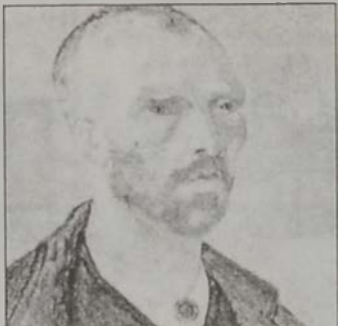
Վան Կոկ. «Ինքնանկար»

Երկու արուեստագէտները 1888ին շուրջ 9 շաբաթ միասին անցուցած են հարաւային Ֆրանսայի մէջ: Անոնք զիրար խանդավառած են, միասին գծած են եւ իրարու հետ կրուած: Յարաբերութեան զգաթնակցութիւնը արդի արուեստի պատմութեան ամէնէն տրամաբխ իրադարձութիւններէն մէկն է եւ առաջին պելի կարգ անցած է. մեծ լուրջ մը ետք վիւնսթ վան Կոկի իր ականջին մէկ մասը կտրելէ ետք, ի վերջոյ կամովին դիմած է մտային հիւանդներու բուժարան մը, իսկ Փօլ Կոկէն խոյս տուած է դէպի Հարաւային Նաղաղականի սփերի: