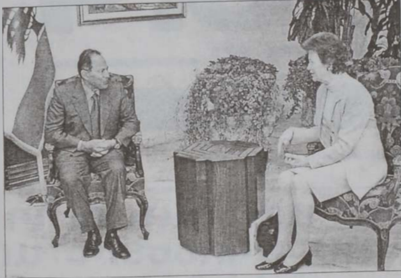
Նախագահ Լաճուտ կ'ընդունի Մէյրի Ռոպինսընը

Նախագահ Լաճուտի այցելուները հաղորդեցին, որ ան դիտել տուաւ, որ այս ժողովի արդիւնքները սովորականին պէս ցոյց տուին, թէ որքան ամուր եւ երկու երկիրներու եղբայրական կապերը եւ որքան երկու երկիրները կը փափաքին զարգացնել եւ բարձրացնել զանոնք՝ գործակցութեան եւ համակարգումի զգաթնակէտին, մասնաւորապէս Ասատի արտայայտած տեսակէտները իրարու համապատասխանեն, որովհետեւ երկուքն ալ միեւնոյն մեկնարանութիւնը կու տան զէպերու ընթացքին եւ զարգացումներուն: