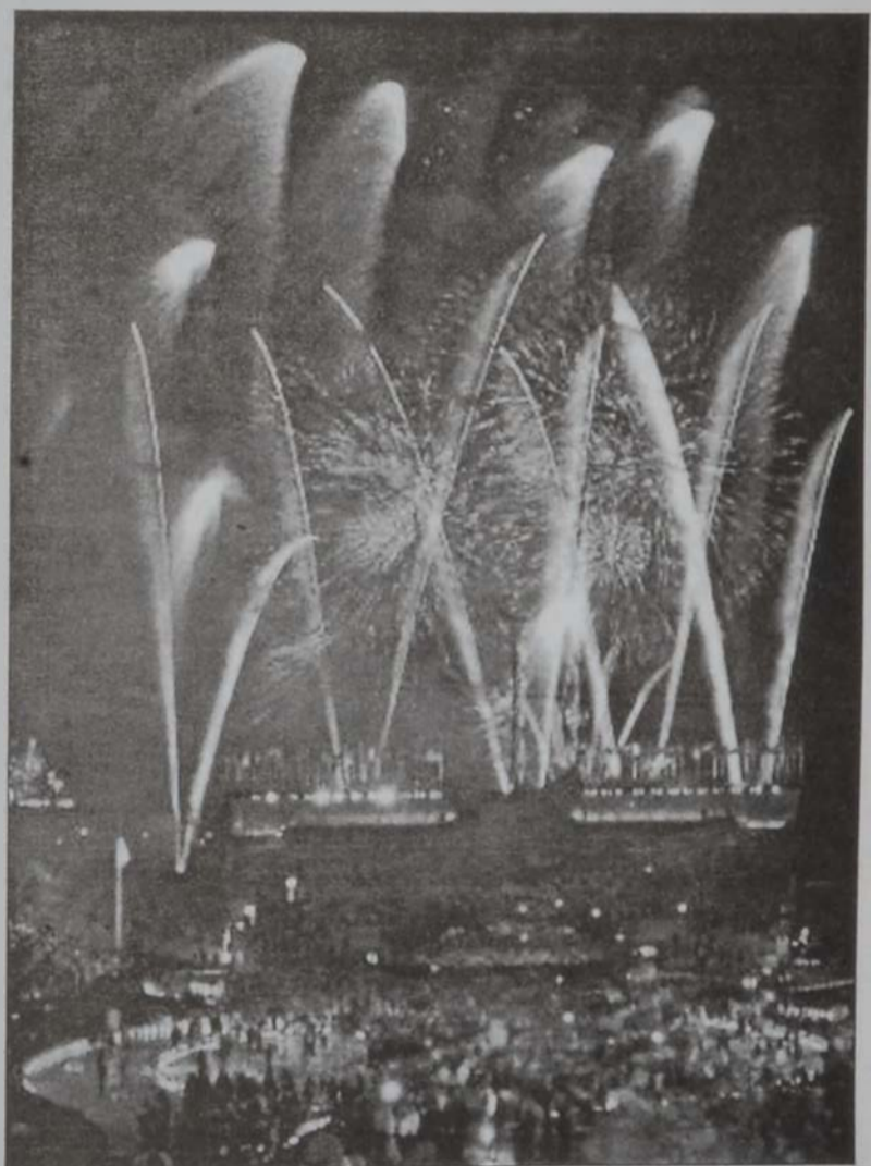
Հրավառութենէն տեսարան մը: