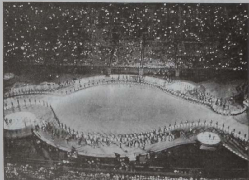
Մարզիկներու տողացքէն տեսարան մը: