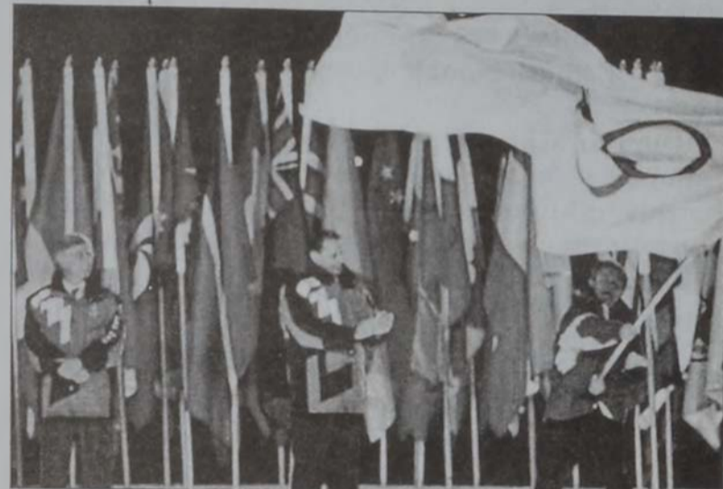
Ժաք Ռոկը (կեդրոնը) կը յայտարարէ Ողիմպիականի փակումը:

Միջազգային Ողիմպիական Կոմիտէի նախագահ Ժաք Ռոկ յայտարարեց, որ յաջորդ ժամադրավայրը պիտի ըլլայ չորս տարի ետք՝ Թորինոյի մէջ: