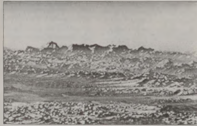
Չինաստանի կառավարութիւնը որդեգրած է միլիառաւոր տոնային արժողութեամբ ծրագիր մը՝ երկիրն չափազանց ապականած ջուրի ճամբարները եւ օդը մաքրելու համար:

Կառավարութիւնը կը գիտակցի, որ երկիրն կենսոլորտը չափազանց վատ վիճակի մէջ կը գտնուի: Վարչապետ ժու Ռոնկի կացութիւնը նկարագրած է իբրեւ «ծանրակշիռ» եւ ապագան՝ «ոչ լաւատես»: