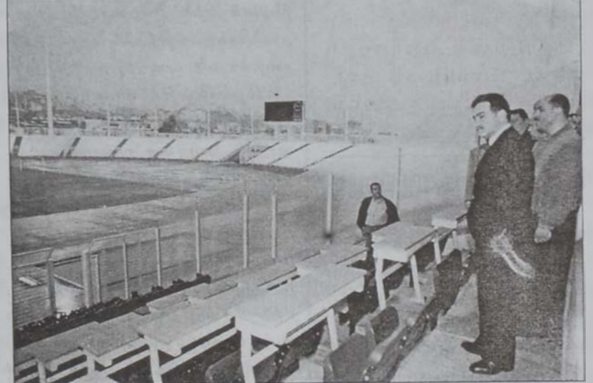
Նախարար Յովհաննէս կը ընկէ Սայտայի դաշտը:

Երիտասարդութեան և մարմնակրթութեան նախարար Սեպուհ Յովնանեան երէկ Սայտայի միջազգային մարզադաշտին մէջ ժողով մը գումարեց նախարարութեան ընդհանուր տնօրէն Չէյտ Սիւմէի, Բարաւեան մանկ. Կերաշի-նութեան խորհուրդի ներկայացուցիչ Իպրահիմ Շահրուրի և մարզադաշտի կառուցման աշխատանքի ուսումնասիրութեան և գործադրութեան ընկերութիւններու ներկայացուցիչներուն հետ: