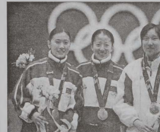
Չախէճ՝ աջ. Եանկ, Եանկ եւ Կի - Հիուճ

Քանադա շահեցաւ տղոց այս - հոգիի աւարտական մրցումը: