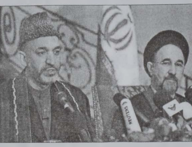
Քարգայ եւ Խաթեմի

Իրան թալիբաններու դէմ պայքար մղած է իր սիսի Դաշինքին գորակող կանգնած զլիաւոր երկիրներէն եղած է, սակայն իրանցի բազմաթիւ պահանջողականներ ներկայիս կը զգուշանան Աֆղանիստանի մէջ ամե-