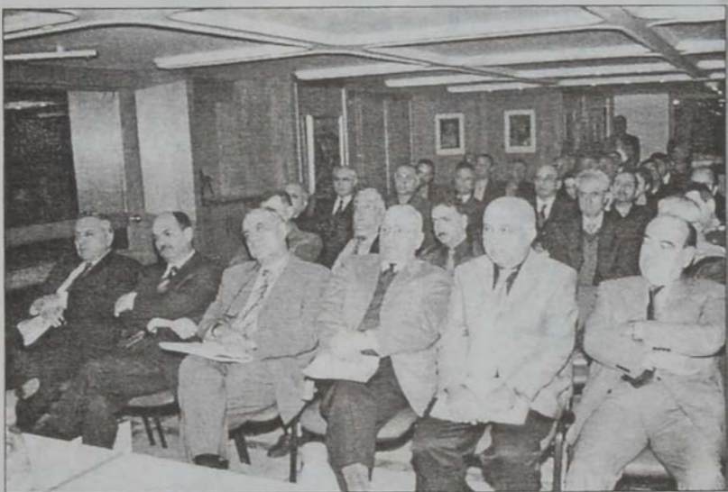
Ներկայացրեց մաս մը:

Այս կացութեան հետևանքով, քաղաքացիին եւ յատկապէս արդիւնաբերող ու գործարար դասակարգին մօտ յառաջացած շփոթը պարզելու եւ գործնական գիտելիքներ փոխանցելու նպատակով, Լիբանանցի Արդիւնաբերողներու Միութիւնը կազմակերպեց հասնողի ունեցաւ երէկ երեկոյեան ժամը 6:00ին, «Կարտըն Թատրը» պանդոկին մէջ: