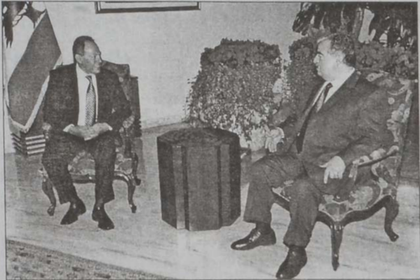
Վարչապետ Հարիրի այցելեց զօր. Լահուտի:

Միացեալ Նահանգներու նախագահը իր հեռագիրին մէջ նաեւ կը հաստատէ, որ երկու երկիրները հետաքրքրուած են միջազգային ահաբեկչութեան դէմ պայքարով: