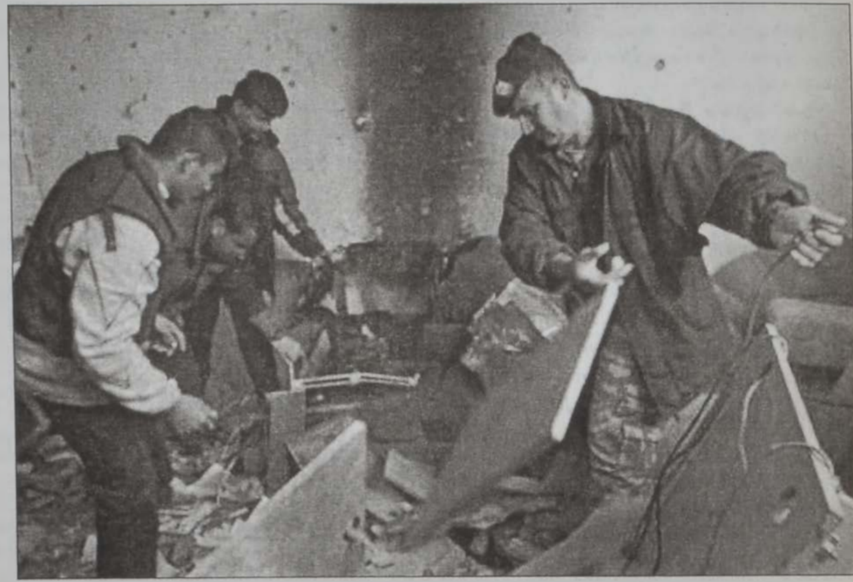
Համասի գրասենեակը՝ քարուքանդ:

կոծումը կը պատասխանէր պաղեստինեան յարձակումներուն, որոնք չորս իսրայելացիներ սպաննած էին անցեալ շաբթուան ընթացքին: Փոխադարձ յարձակումները կը հարուածեն ամերիկեան ու եւրոպական խաղաղա-