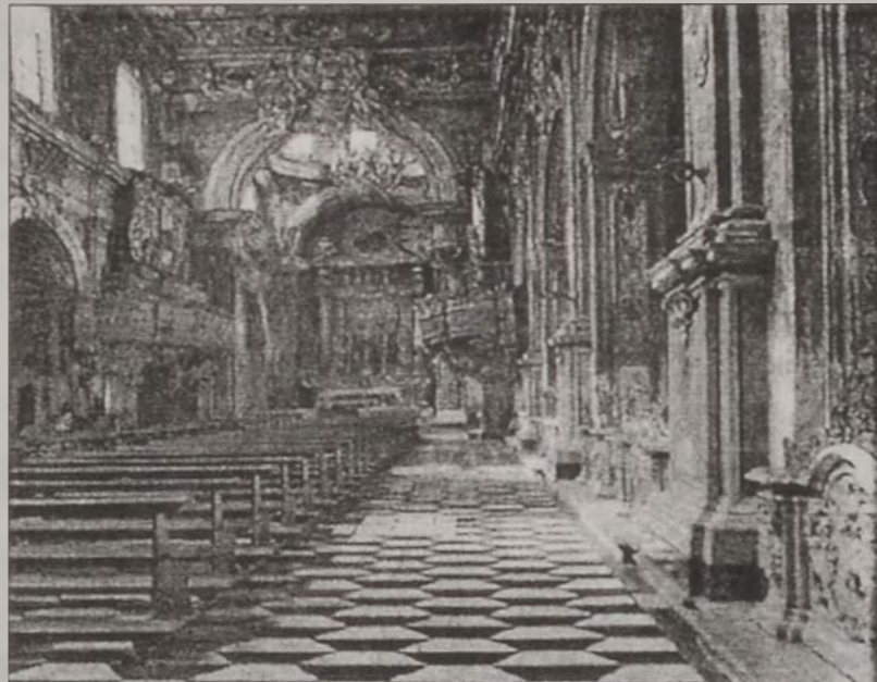
Նափոլիի Սան Կրեկորիօ Արմենօ եկեղեցին

Նարտու անուն մըն է իտալական թերակղզիին հարաւ-արեւելեան ծայրամասի թերակղզիին մէջ, ուր փոքրաթիւ հայեր գացին ու բնակութիւն հաստատեցին, եւ որոնք հետագային ստուարանալով եկեղեցական համայնք կազմեցին. յիշուած է, որ հոն հայկական եկեղեցի եղած է, կամ ալ տեղական եկեղեցիի մը մէջ