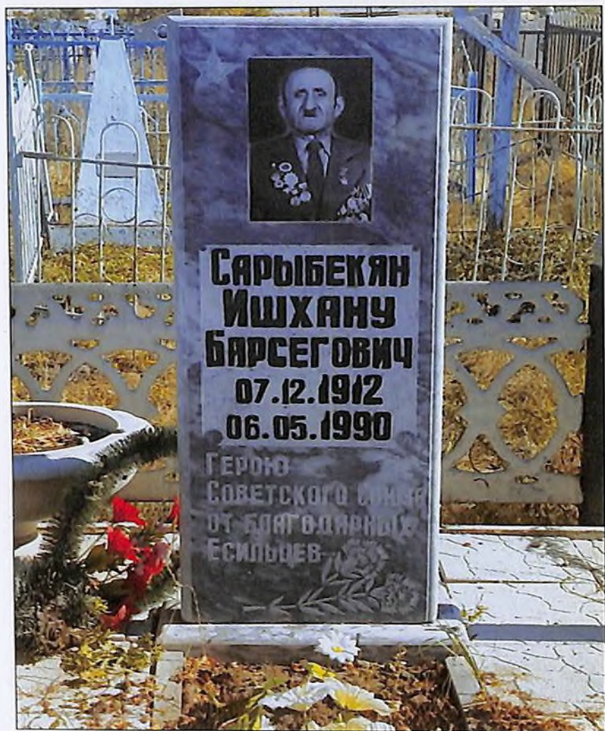
Памятник на могиле Героя