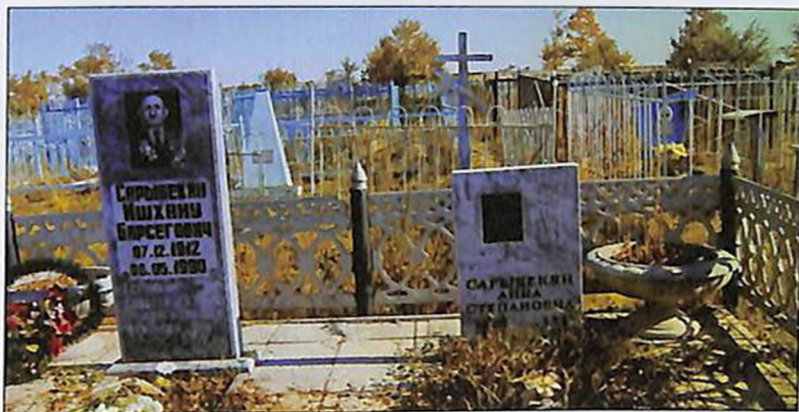
Могила И. Б. Сарибекяна в г. Есиль