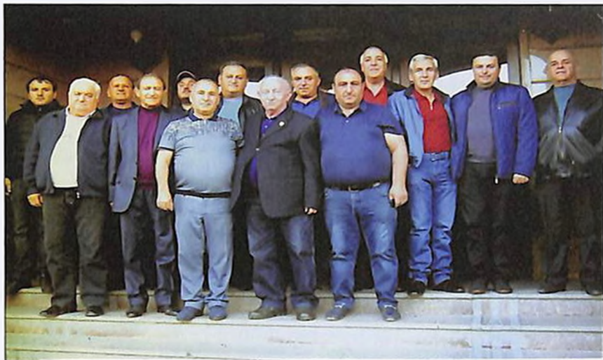
Кокшетау, 24 сентября 2017 г. Группа активистов Армянского культурного центра “Бари” (“Добрый”)