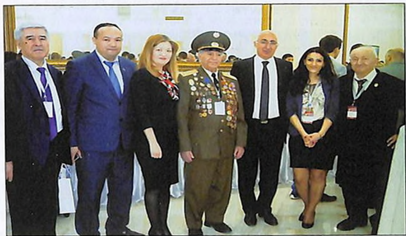
Астана, 28 апреля 2017 г. Армянская делегация на Международном форуме Победителей “Великая Победа, добытая единством: мужество фронта – стойкость тыла”