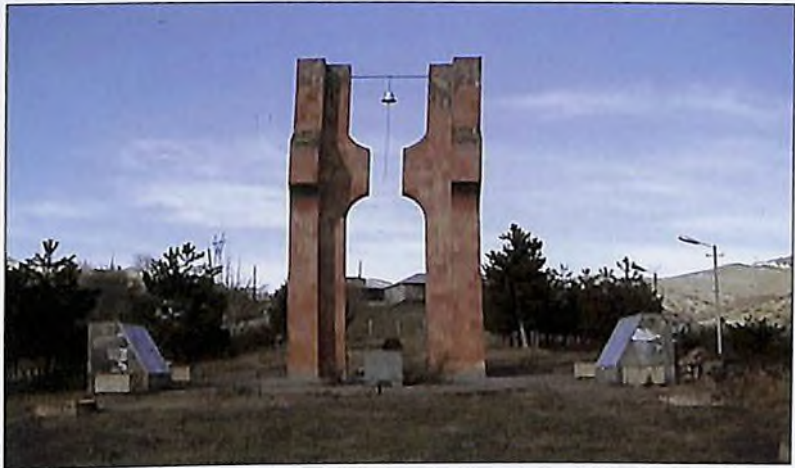
Памятник в Воскеване