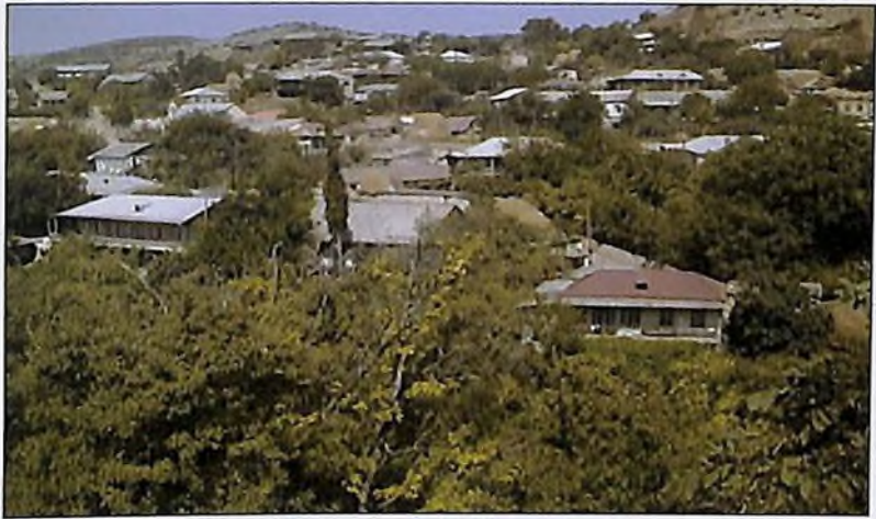
Родина Героя – село Воскеван