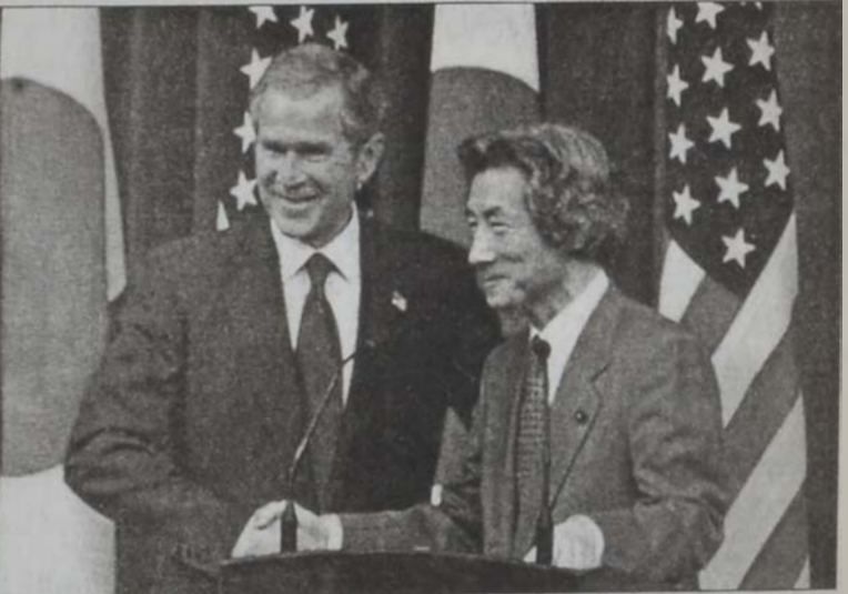
Պուշ Եւ Բոլղումի

Մ. Նահանգներու նախագահ Ճորձ Պուշ երէկ զօրակցութիւն յայտնած է Ճափոնի վարչապետ Եուիչի-րո Քոյզումիի եւ անոր առաջարկած տնտեսական բարեկարգութեան շանդէպ, մինչ ճափոնցի ղեկավարը կ'ըսէր, թէ երկիրը կորսնցուցած է իր ինքնավստահութիւնը: