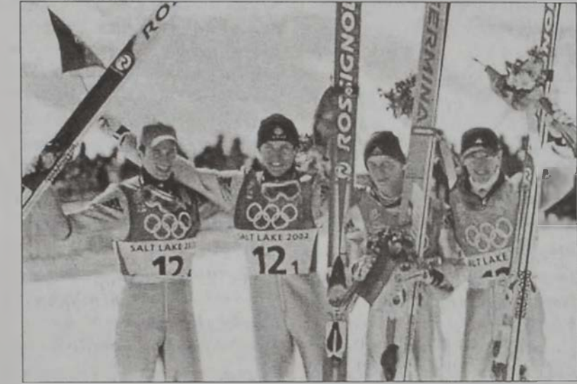
Գերմանիոյ տղոց դահուկարշաւի խումբը