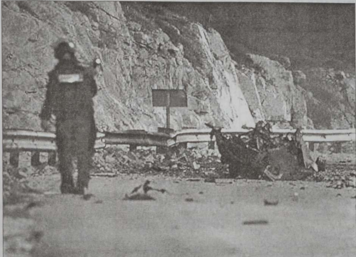
Ականուած ինքնաշարժի մնացորդները:

Իսրայէլ կը պատրաստուի դիմագրաւելու պաղեստինեան անձնասպանական նոր գործողութիւններ՝ երէք կասկածելիներ՝ ձերբակալելէ ետք: Վարչապետ Արիէլ Շարոնի բանբերը՝ Ռասան Կիսիւն ըսաւ, որ բոլոր ապահանջները ցոյց կու տան, որ պաղեստինեան ծայրաշեղական շարժումներ անձնասպանական գործողութիւններու նոր ալիքի մը պիտի ձեռնարկեն Իսրայէլի դէմ: Կիսիւն աւելցուց, որ Իսրայէլի կառավարութիւնը այս շաբթուան ընթացքին պիտի քննարկէ ռազմավարութիւնը, որ պիտի որդեգրուի կանխարգիլելու համար պաղեստինցիներուն յարձակումները, որոնք թափ ստացան անցեալ շաբթուան մէջ: