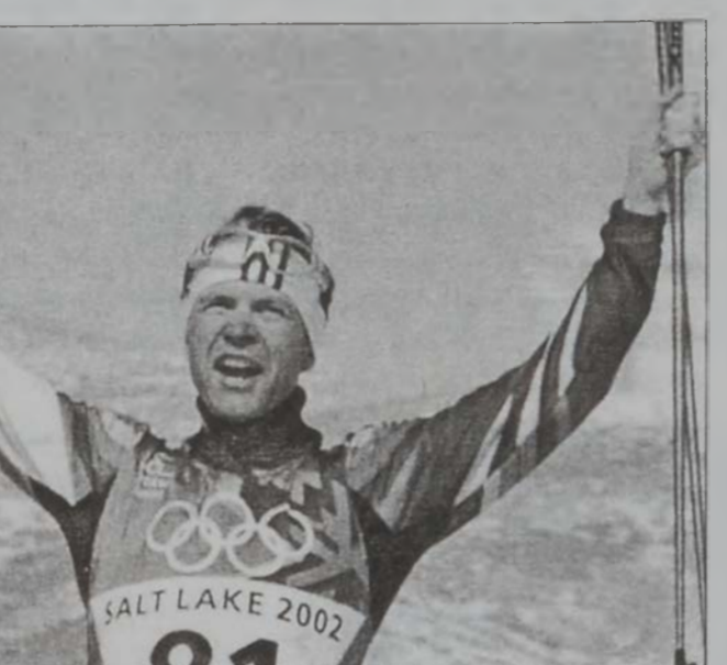
Օլէ Էյնար Պիոնտալէն

Սուր Լէյք Սիթիի մէջ տեղի ունեցող 2002ի Չմենային Ողիմպիական մրցումներուն, Նորվեկիա տիրացաւ իր հինգերորդ ոսկի մետալին, շնորհիւ Օլէ Էյնար Պիոնտալէնի, որ 10 քմ. դահուկարշաւի մրցումներուն, սփրիւթով շահեցաւ ոսկի մետալը: Շարաթաւիկներն ան շահած էր իր առաջին ոսկի մետալը, երբ 20 քմ. անհատական մրցումներուն հանդիսացած էր առաջին: Շարաթաւիկը շին,