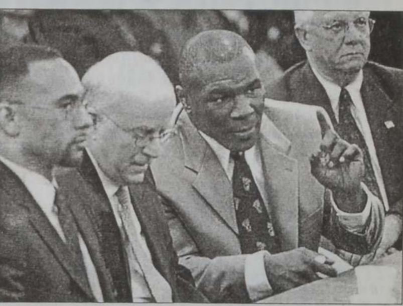
Թայսոն իր փաստաբաններուն հետ կը փորձէ արտօնագիր մը ձեռք ձգել

Շատ մը քաղաքներ, որոնց կարգին՝ Պէյրութ, իրենց ամէն ճիգը ի գործ կը դնեն հիւրընկալելու համար կոփամարտի պատմութեան մէջ ամէնէն հաշակաւոր եւ ցարդ իր տեսակին մէջ եզակի ճակատումը, որ իրարու դէմ պիտի հանէ ծանր կշիռի հսկանք՝ ամերիկացի Մայք Թայսոնը եւ բրիտանացի Լիւիս Լուիսը: