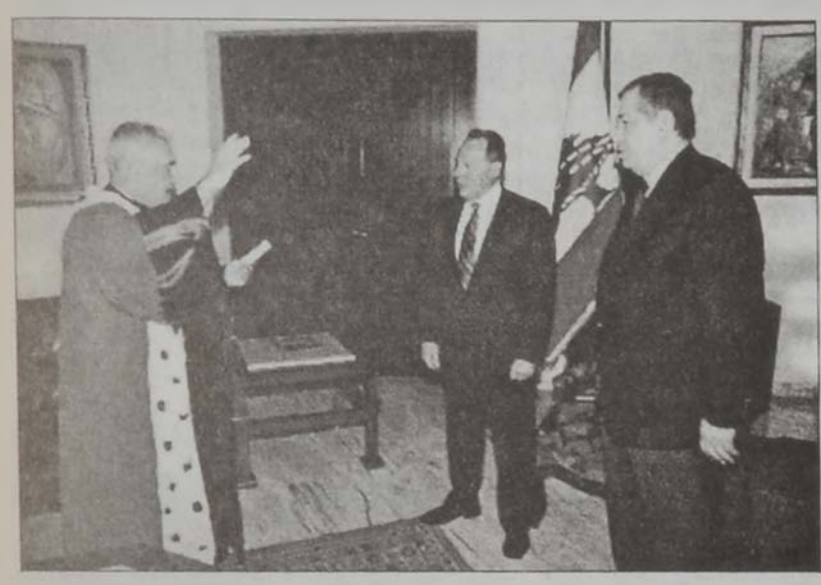
Նախագահը եւ ժըսը կ'ընդունին Լահուտի երգումը:

Նախագահ զօր. Էմիլ Լահուտ երէկ Պապատայի պալատին մէջ ընդունեց երգումը Գերագոյն Ատենանի խորհուրդի նոր նախագահ Նասրի Լահուտի: Երգման արարողութեան ներկայ էր արդարութեան նախարար Սամիր ժըսը: