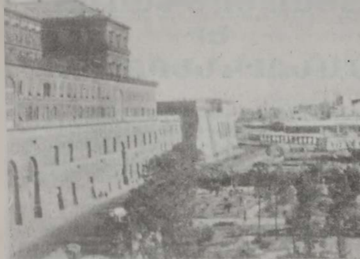
Նափոլիի թագաւորական պալատը:

Ռոժէ թագաւոր հզօր նաւատորմ պատ- րաստեց, գրաւեց ներկայ Թունուզի մեծ մա- սը, այնուհետեւ՝ Քորֆուլու եւ յունական ծո- վափնեայ շրջաններ, առեւանգեց թեպէտք արծաթադրոճ վարպետներ եւ իր հետ Սիկի- լիա տարաւ, մայրաքաղաք Փալերմոյի մէջ աշ- խատեցնելու համար: 1149ին ան հասաւ Վոսփո- րի ափերը: Ռոժէ Բ.-ի օրով Սիկիլիա մշակու- թեամբ զարգացաւ: