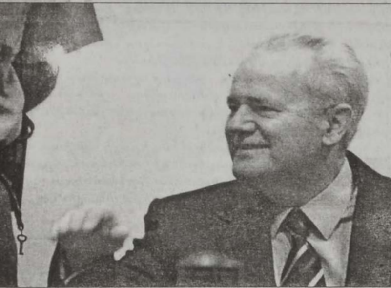
Միլոշեւիչ՝ դատավարութեան ընթացքին միջոց ալ սառնասրտութեամբ ունկնդրեց իրեն ուղղուած ամբաստանութիւնները:

Սլովոտան Միլոշեւիչ Պալաքանեան շրջանի տարածքին սպանութեանց, չարչարանքներու եւ տեղահանումներու արշաւներու ետին կանգնող ուղեղը եղած է՝ անոր իշխանութեան արիւնալի մէկ տասնամեակին ընթացքին, յայտնած են դատախազներ երէկ Եւրոպայի պատերազմական ոճիրներու կապուած 50 տարուան մեծագոյն դատավարութեան բացումին առիթով: