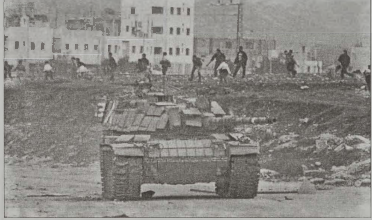
Իսրայելեան հրասայլ մը կը ցերխուծէ Նապլուս, մինչ պաղեստինցիք կը դիմարեցն քարերով...

Իսրայելեան ուժերը երէկ ալ շարունակեցին պաղեստինեան գիւղեր ու քաղաքներ ներխուժելու գործողութիւնները՝ մէկ հոգի սպաննելով եւ 12 հոգի ձերբակալելով: Իսրայելեան բանակը գործողութիւնները կը շարունակէ անտեսելով ամերիկեան քննադատութիւնները: