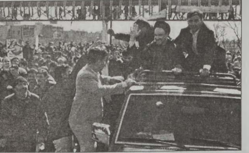
Խաթեմի կ'ողջունէ ցուցարարները:

Սովորականէն աւելի մեծ թիւերով, տասնեակ հազարաւոր իրանցիներ երէկ մասնակցած են իսլամական յեղափոխութեան 23րդ տարեդարձին առիթով ցոյցերու՝ մարտահրաւեր ուղղելով ամերիկեան այն ամբաստանութիւններուն, թէ Իրան մաս կը կազմէ «չարութեան առանցք»ի մը: