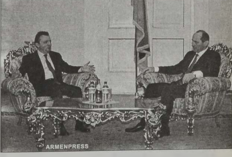
Հայաստանի նախագահ Ռոպէրթ Քոչարեան երէկ ընդունեց Ֆրանսայի Պուշ Եր Ռոն նահանգի Կեդրոնական Խորհուրդի նախագահ Ժան Նոէլ Քերիէի զխաւորած պատուիրակութիւնը:

Հանդիպումին ընթացքին Քերիէի շեշտեց երկու երկիրներուն միջեւ աւանդական բարեկամութիւնն ու գործակցութիւնը շարունակելու եւ գործնական նոր քայլերով ամրապնդելու անհրաժեշտութիւնը: Ան նախագահին տեղեկացուց, որ Հայաստանի Շիրակի մարզի եւ Ֆրանսայի Պուշ Եր Ռոն նահանգին միջեւ ստորագրուած է համագործակցութեան հռչակագիր մը: