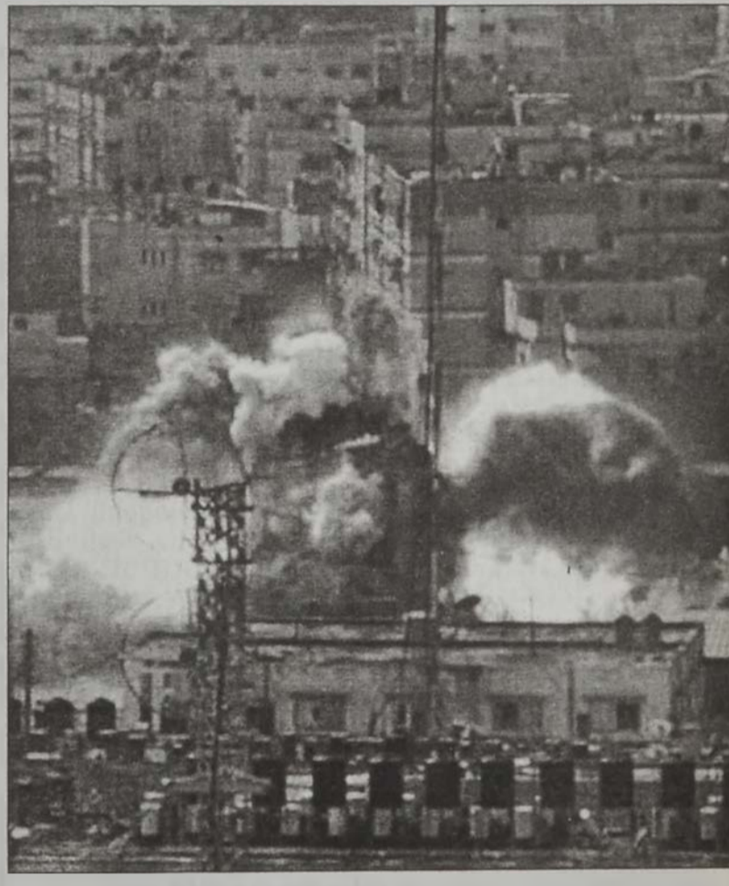
Պաղեստինեան ապահովութեան ուժերու համալիրը՝ բոցերու մէջ:

Հակադարձելով պաղեստինցիներու կողմէ նոր հրթիռի մը գործածութեան, Իսրայէլ երէկ թափ տուաւ Կապալի դէմ օդանաւային յարձակումին, մինչ աջակողմեան նախարարներ ճշդում կը բանեցնեն վարչապետ Արիէլ Շարոնի վրայ, որպէսզի տապալէ պաղեստինեան իշխանութեան նախագահ Եսաէր Արաֆատը: Պաղեստինցի ղեկավարը իր կարգին յայտարարեց, որ Իսրայէլ պիտի չյաջողի փոխարինել Կիտէ, իբրեւ ընկերակիցը խաղաղութեան գործընթացին: