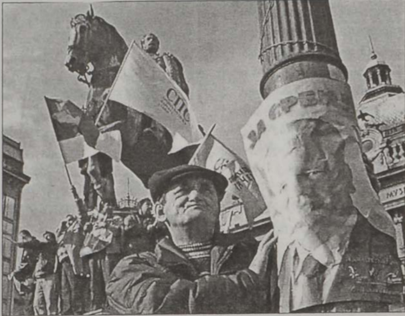
Միլոշեւիչի գորակցութեան ցոյցեր:

ԼՍ ՀԷՅ, 10 (ՌՈՅ-ԹԸՐԶ).- Եռլուսլաիոյ նախկին նախագահ Սլոպոտան Միլոշեւիչի դատավարութիւնը պիտի սկսի Երեքշաբթի օր (վաղը): Ան ամբաստանուած է 1990ական թուականներուն Պալքանեան շրջանին մէջ համայնքային բնոյթի մաքրագործումներ կատարած ըլլալու յանցանքով: