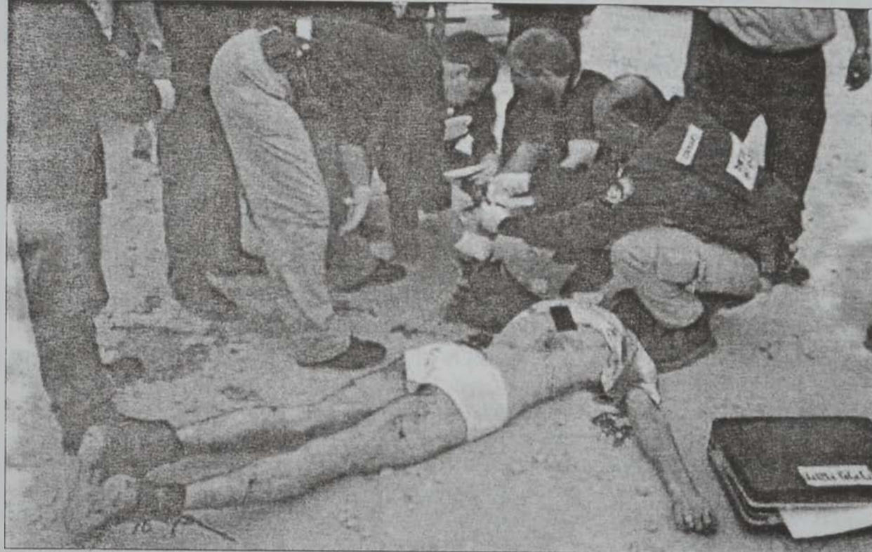
Սպանուած պաղեստինցիի դիակը

Իսրայէլեան օդուժի «ԷՖ. 16» օդանաւեր երէկ գիշեր ուժակոծեցին Կապայի մէջ պաղեստինեան ոստիկանութեան կեդրոններ, պատճառելով բազմաթիւ վիրաւորներ, որոնց մէջ կան ծանրըներ: