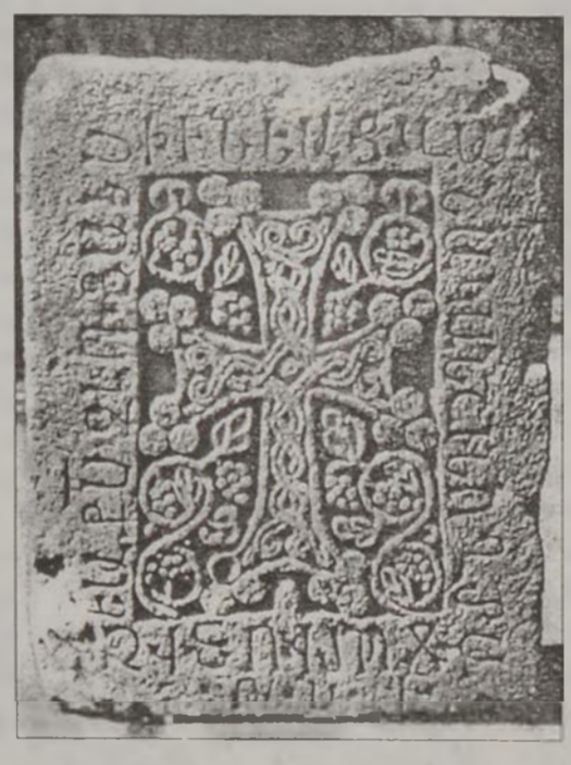
Արժուանիկ, եկեղեցւոյ շինութեան առիթով կերտուած խաչքար, 991 թ.

ՃԱ. - ՃԳ. դարերում սկսած, երեւան են գալիս ճարտարապետական տոմէ Խաչքարային կոթողները կառուցուածքային, քանդակագործական յորինուածքի եւ ճարտարութեան զարգացման վերելքը: Իրենց ձեւաւորման եւ տիպականացման աւարտին հասած խաչքարերն ըստ