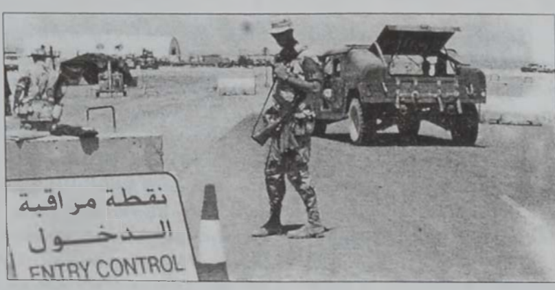
Ամերիկեան ուժերու անցարգել Սեուտական Արաբիոյ մէջ:

Այն փաստը, որ Մէնտալան Արաբիա պատրաստ է վտանգի տակ դնելու իր հիմնական դաշնակիցին հետ իր յարաբերութիւնները, ցոյց կու տայ թէ որքան զօրաւոր է ռազմամէտ կրօնաւորներու կողմէ բանեցողութեան ճանաչումը: Մէնտալի բարձրաստիճան պաշտօնատարները յայտնեցին, որ Ռիատի, Ճեստայի եւ Պուրայտայի մէջ ծառայող կրօնաւորներ անցնող երկու շաբթուան ընթացքին գէթ պաշտօնապէս ներկայացուցած են իրենց հրաժարականները, իրենք բողոք չարունակելով ամերիկեան դին-