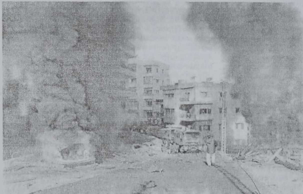
Հրպայքայի ինքնաշարժը՝ աջից, եւ անոր թիկնապահին ինքնաշարժը՝ ձախից, բոցերու մէջ, պայթումէն աճմիջապէս ետք:

Պայթումին ուժգնութիւնը բազմապատկուեցաւ Հրպայքայի ինքնաշարժին մէջ գտնուող սուպուրու յատուկ «օքսիժէն»-ի շիշերուն պայթումին պատճառով: Հրպայքայի եւ անոր ընկերակցողներուն դիակները ինքնաշարժին աւելի քան 20 մետր հեռու վայրի մէջ գտնուեցան, իսկ պայթումը պատճառեց