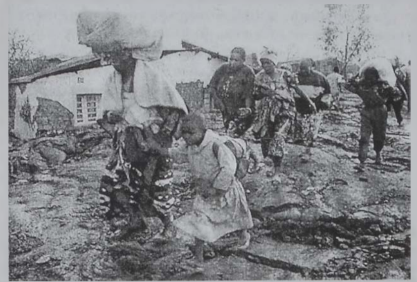
Զոնկոնցիներ կը վերադառնան իրենց քանդուած բնակարանները:

ԿՈՄԱ. (ՔՈՆԿՈ), 20 (ՌՈՅԹԸՐԸ).- Տասնեակ հազար տարի մարդիկ, որոնք Քոնկոյի մէջ հրաբխային ժայթքումէն խոյս տուած էին, Կիրակի օր ետացող լաւաքի դաշտերէն անցնելով վերադարձած են իրենց քանդուած քաղաքները, մերժելով ընկերային ծառայողներու կողմէ հաստատուած գաղթականացումը մէջ մնալ: