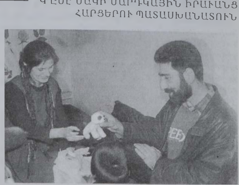
Կ'ԸՍԷ ՄԱԿԻ ՄԱՐԴԿԱՅԻՆ ԻՐԱՄԱՆՑ ՀԱՐՑԵՐՈՒ ՊԱՏԱՍԽԱՆԱՏՈՒՆ

«Անոնց հանգամանքը սահմանուած է եւ անոնք պաշտպանուած են 1949ի ժրնեի համաձայնութիւններով. անոնք պատերազմի զերիներ են», ըսած է Ռոպինսընը: Ան աւելցուցած է, որ եթէ որեւէ կասկած կայ անոնց հանգամանքին մասին, ժրնեի համաձայնութիւնները, զորս ստորագրած են Մ. Նահանգները, կը պահանջեն, որ հարցը վճռուի ատենանի մը կողմէ: Մարդկային իրաւանց խմբակներ արգէն իսկ իրենց գայթակհողութիւնը արտայայտած են այն երեւթիւնի մասին, որ բանտարկեալներ Աֆղանիստանէն Բուլղարի Կուլանթան մարտի ամերիկեան խարխուխ թռիչքին ընթացքին ձեռնակապերով եւ դէմքերը փակ փոխադրուած են: Անոնք խարխուխ մէջ բացօթեայ վանդակներու մէջ արգելափակուած են: Ռոպինսըն, որ իրլանտայի Նախկին մէկ նախագահն է, մտահոգութիւն արտայայտած է այն պայմաններուն մասին, որոնց ներքեւ արգելափակուած են զինեալները: