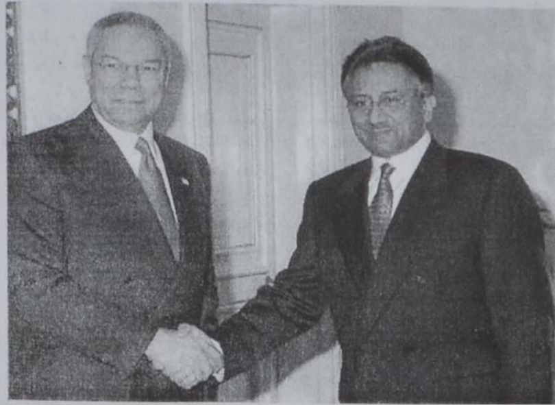
Քուլին Փաուրը կը տեսակցի Փաքիստանի Արտաքին գործերի նախարար Ալի Մաթթարի հետ: Տեսակցութեան ասարտին, Փաուրը ըսաւ, որ կարելի չէ պատերազմ մը ունենալ Հարաւար յին Ասիոյ մէջ, հետեւաբար, հակամարտ կողմերը պետք է գործակցին լուծելու համար տագնապը:

Միացեալ Նահանգներու արտաքին գործոց նախարար Քուլին Փաուրը կը շնորհակալուի Հնդկաստանի եւ Փաքիստանի գործակցելու խուսափելու համար ճակատումէ մը: