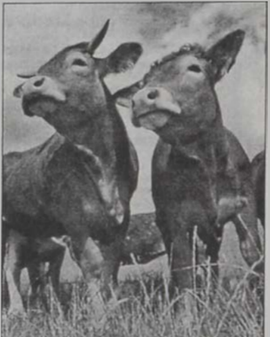
Նաեւ ... կովերը

Ազատամարտ ակումբը այս Հինգշաբթի եւ ամէն Հինգշաբթի ժամը 8:00-ին տեղ կ'ընդու- նի իր բարեկամները եւ ազգայինները աղան- դերի ձոխ սեղանի շուրջ: Համեղ ուտելիք, հում եւ պատրաստուած մսեղէն եւ խմորեղէն (30 տեսակ): Խմիչքի զանազան տեսակներ յարմար գիներով: Այս Հինգշաբթի օր ցան՝ ՓԱՉԱ Կարելի է նախապէս ապահովել սեղաննե- րը հեռաձայնելով Ազատամարտ ակումբ 01/ 449924: Կարելի է նաեւ ապահովել ապապարմը ձեր տուններու կամ հաւաքներուն համար: