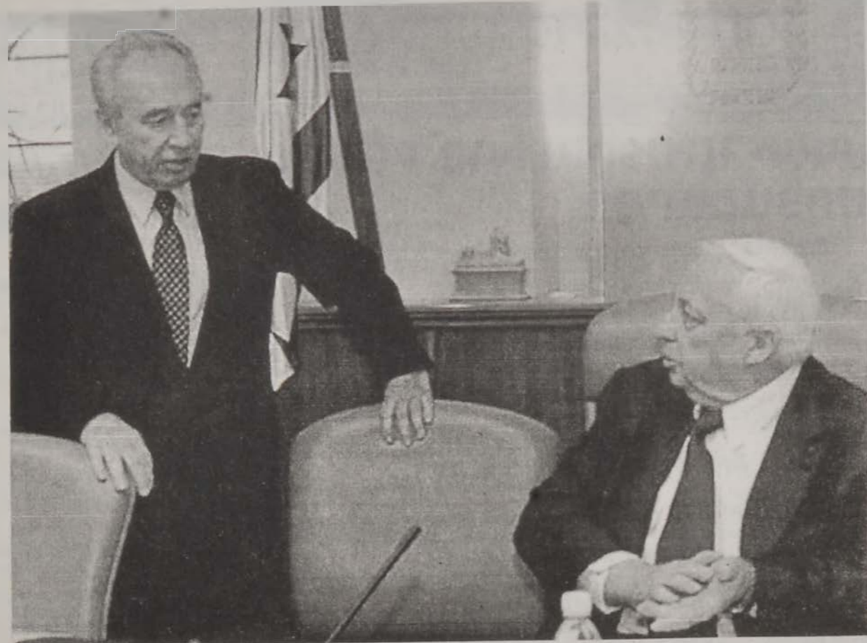
Փերէս եւ Շարոն՝ կառավարութեան երէկուան ժողովին ընթացքին:

Կապալի մէջ իւրայէլեան բանակի հրամանատար Եիւրայէլ Ջիւ շեշտեց, որ ժամանակէ մը ի վեր պինդախնայութեամբ քանդու-մը իրականացուցած էին Ռաֆաի գաղթականներուն մէջ քանդու-մը: Անան ըսաւ, որ այս արարքներով Իւրայէլ հաւաքական պաղտակներու կ'ենթարկէր: Ջիւ աւելցուց, որ միայն 21 բնակարան քանդուած է: Ան դիտարկեց, որ որեւէ տարբեր տեղեկութիւն, որ կը հրապարակուի պաղտակներու փամփուռներէն փրկելու համար սահմանի վրայ իսկող խառնուրդը քննարկուի: