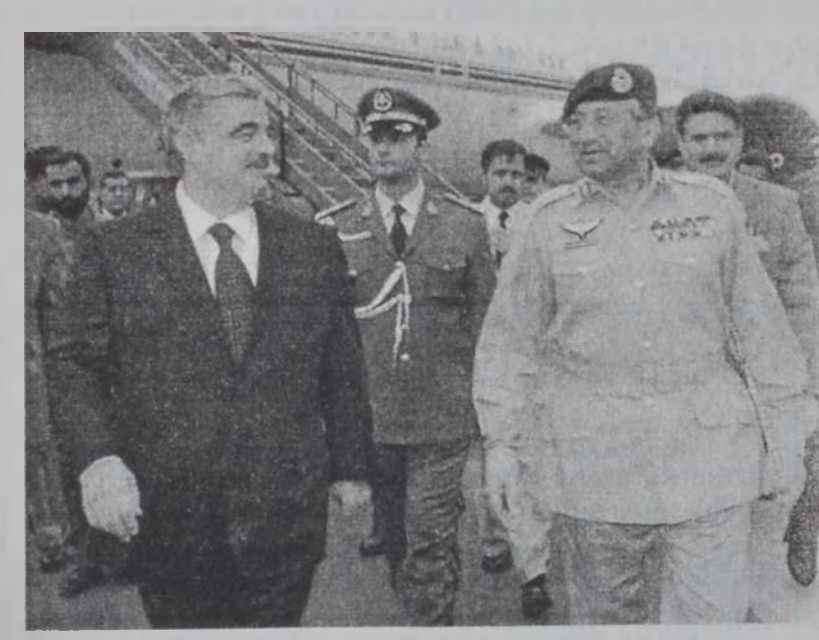
Հարիրի կը հասնի Իսլամապատ եւ կը դիմաւորուի Մուշարրաֆի կողմէ:

Վարչապետ Ռաֆիք Հարիրի Եւրոպայի իսլամապատ կարճատեւ այցելութենէ մը ետք վերադարձաւ Պէյրութ: Ան մեկնած էր Պրիւքսէլ, ապա Փարիզ, որմէ ետք Փաքիստան: