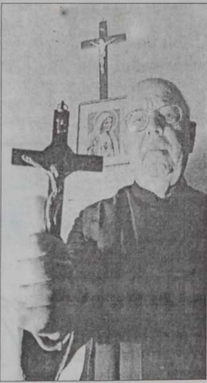
Դիւանան իր գրասենեակին մէջ:

Կարգաւ, թէ չկարգաւ Հէրի Փոթըրը. մանկավարժական տեսակէտէն՝ մանուկին բան մը արգիլելը միայն կը սրէ անոր հետաքրքրութիւնը: Ազատամիտ ծնողներ պիտի մերժէին, թէ ի վերջոյ մանուկը ինք կ'որոշէ սիրել կամ չսիրել Փոթըրի պատմութիւնները: Փնտռել, թէ չփնտռել բարոյական ուղղութիւն մը անոնց մէջ. կարգ մը ծնողներ կը կարծեն, որ իրենց զաւակները Հէրի Փոթըրի անիրական աշխարհին մէջ պիտի գտնեն գիրքեք չարչիկող հարցերէն փախուստի միջոց մը՝ բաժնելով օտար միջավայրի մը մէջ ինկած պատանիի մը տաղանայները: Անոնք դաստիարակչական դեր մը չեն փնտրող Հէրի Փոթըրի գիրքերուն մէջ: Ուրիշներ բաւականութիւն կը զգան պարզապէս տեսնելով, որ Փոթըրի պատմութիւնները ընթացանութեան սէրը կ'արթնցնեն իրենց զաւակներուն մէջ: