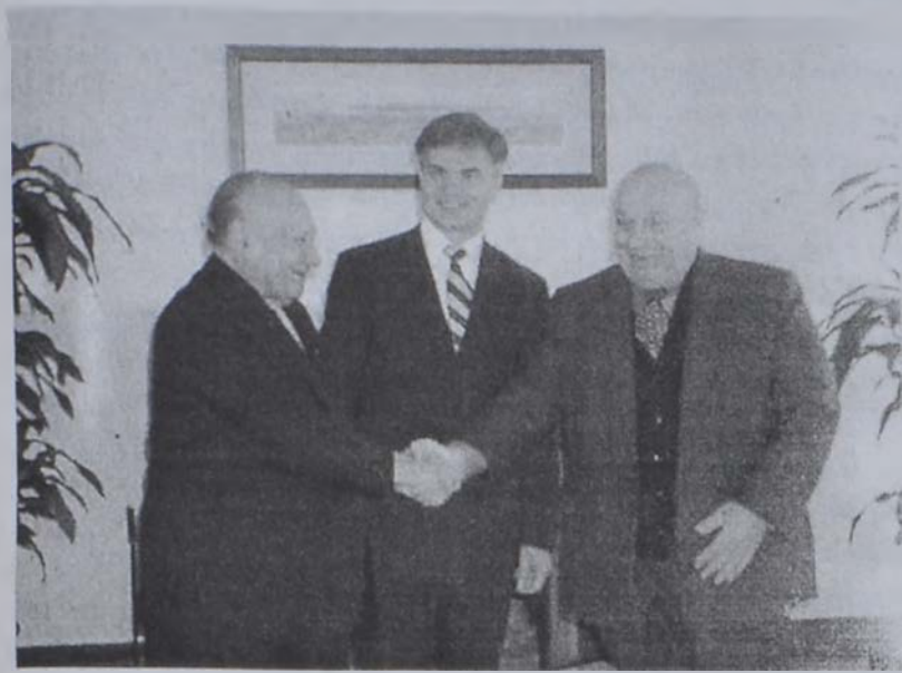
Քլերիտես (ձախից) և Տեքթաշ կը ձեռնուի՞ն՝ ՄԱԿի պատուիրակին Գերկայութեան:

Թուրք կիպրացի ղեկավար Ռուսի Տեքթաշ Ուրբաթ օր յայտնած է, թէ որեւէ խոչընդոտ չի տեսներ կիպրոսի նախագահին հետ համաձայնութիւն մը գոյացնելու գծով՝ տասնամեակներ առաջ կղզիին վրայ անհետացած մարդոց հարցին լուծման գծով: