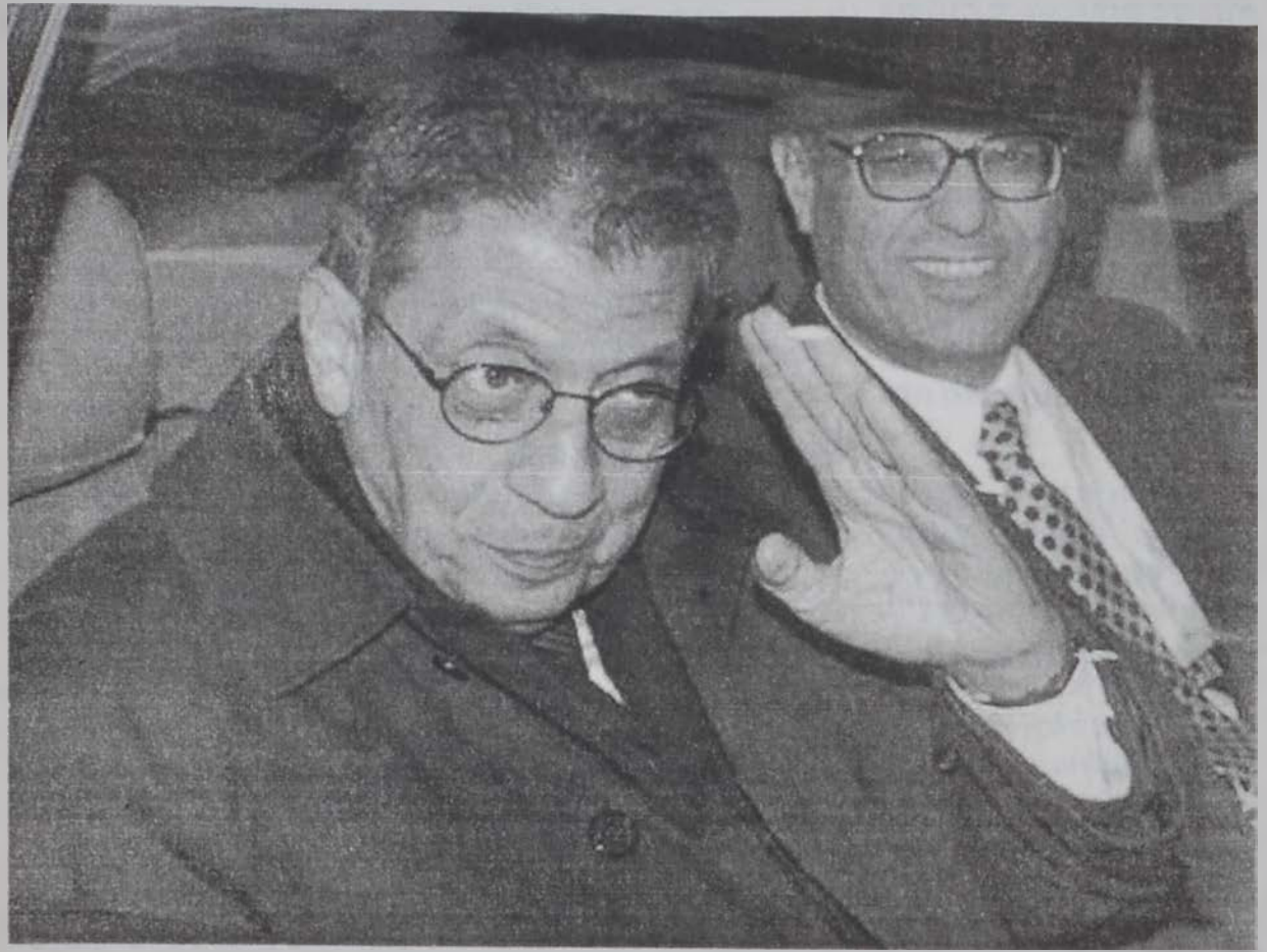
Ամր Մուսա՝ ինքնաշարժից մէջ:

Արարական Լիկայի ընդհանուր քարտուղար Ամր Մուսա երէկ յետմիջօրէին Դամասկոսէն ժամանեց Պէյրութ եւ իր կեցութեան վայրին՝ «Տէնիսի» պանդոկին մէջ ընդունեց մշակութի նախարար Լասսան Սալամէն, որուն հետ