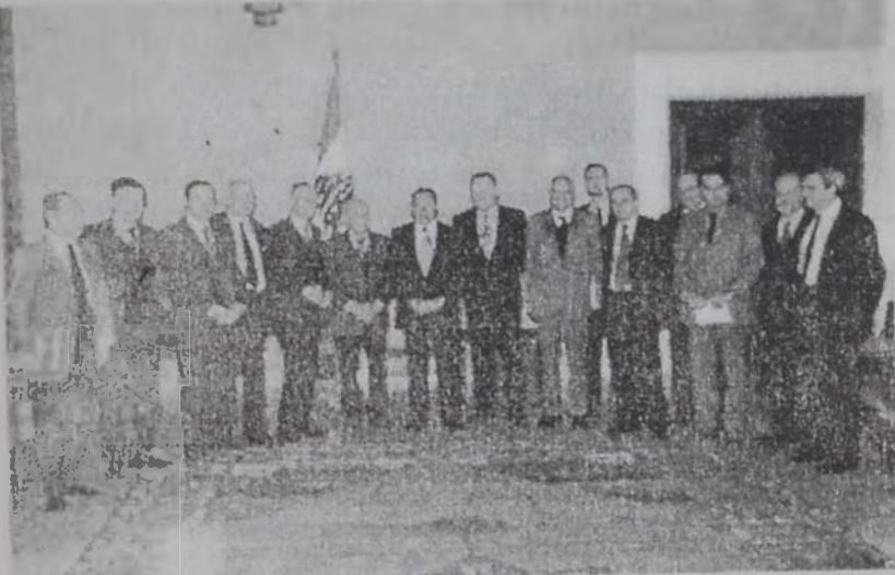
Նախագահ Լահուտ իտալական պատուիրակութեան հետ:

Նախագահ գործադիր Լահուտ երէկ իտալական երեսփոխանական պատուիրակութիւն մը ընդունած պահուն հաւաստեց, որ Պրիւքսէլի մէջ Լիբանանի Եւրոպայի հետ գործընկերութեան համաձայնագրի սկզբնատուութիւնը ստորագրութիւնը առաջին բայց անհրաժեշտ քայլ մըն է, որ կը հաստատէ շրջանային եւ միջազգային ըմբերու վրայ Լիբանանի ներկայութեան կարեւորութիւնը եւ ցոյց կու տայ միջազգային վստահութիւնը Լիբանանի քաղաքական, տնտեսական եւ ընկերային դերակատարութեան ու արեւելքը եւ արեւմուտքը շողկապող անոր իւրաքանչիւր դիրքին նկատմամբ: