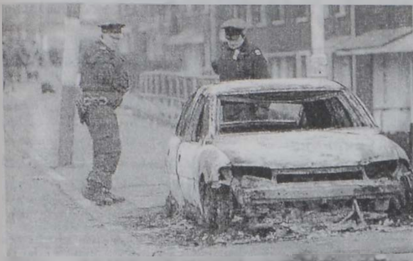
Բախումներում պատճառով քանդուած ինքնաշարժ մը:

ՊԵԼՖԱՍԹ, 10 (ՌՈՅԹԸԸԸ).- Պելֆասթի մէջ երկու անձերու միջեւ ծագած վեճը պատճառ եղաւ, որ ամիսներէ ի վեր հանդարտ Հիւսիսային Իրլանտայի մայրաքաղաքին մէջ կատարուին վայրագութեան դէպքեր, լուսարձակի տակ առնելով երկիրը բաժնող երկու հատուածներու ստեղծութիւնը: