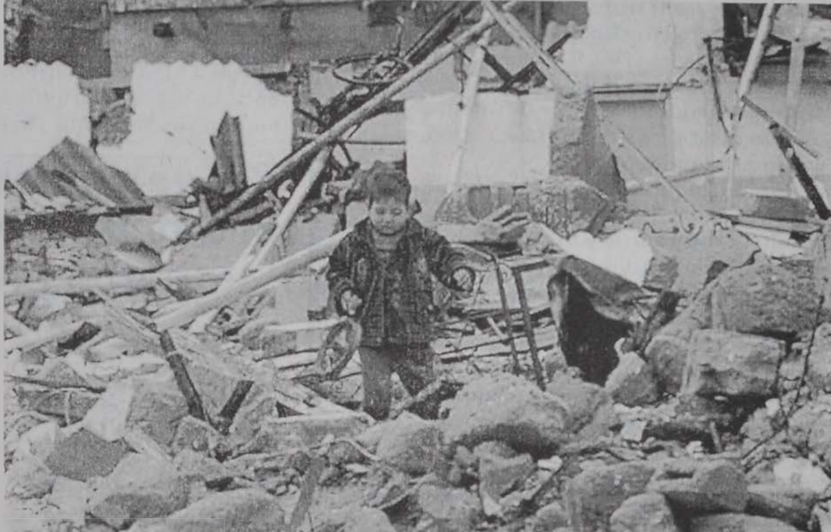
Պաղեստինցի երեխայ մը իր տան փլատակներուն մէջէն կը հաւաքէ խաղալիքի մը կտորները:

Ամերիկեան խաղաղարար ճիգերը նոր հարուած մը ստացան երէկ, երբ Իսլամական Ժիհադ շարժումը յայտարարեց, որ յետս կը կոչէ Իսրայէլի մէջ յարձակումներուն վերջ տալու որոշումը, զոր տուած էր քանի մը շաբաթ առաջ, ընդառաջելով պաղեստինեան իշխանութեան նախագահ Եսսեր Արաֆատի կոչին: