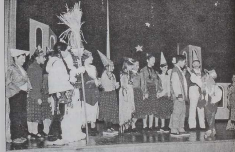
Իտալական դիմակահանդէսը ներկայացնող «Կարկաչ»ի անդամները խմբուած՝ Չիլիկի, Փաթիլիս եւ Սագոյի շուրջ:

Բեմայարդարուած (Գօգօ Արփաճեան) հիանալի յղացումներով յազեցած էր, մասնաւորաբար՝ իւրաքանչիւր երկրի իւրապատուկ ռոմով ու աւանդութեան համապատասխան յարգանքով ճոխացած: Ներկայացման թեման կ'ընդգրկէր աշխարհի զանազան երկիրներու մէջ Նոր Տարին տօնելու աւանդական ձեւերն ու իւրապատուութիւնները: Մեր փոքրիկ դերակատարները, երգիչներն ու պարողները հերթով փոխադրուեցան Լիբանանէն դուրս՝ այցելելով ութ երկիրներ: Հայաստան, Եգիպտոս, Ամերիկա, Ֆրանսա, Իտալիա, Ռուսիա, Զինաստան եւ Հնդկաստան: Իւ-