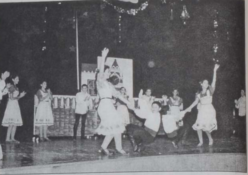
«Գայիանե» կը ներկայացնէ ռուսական պար մը: