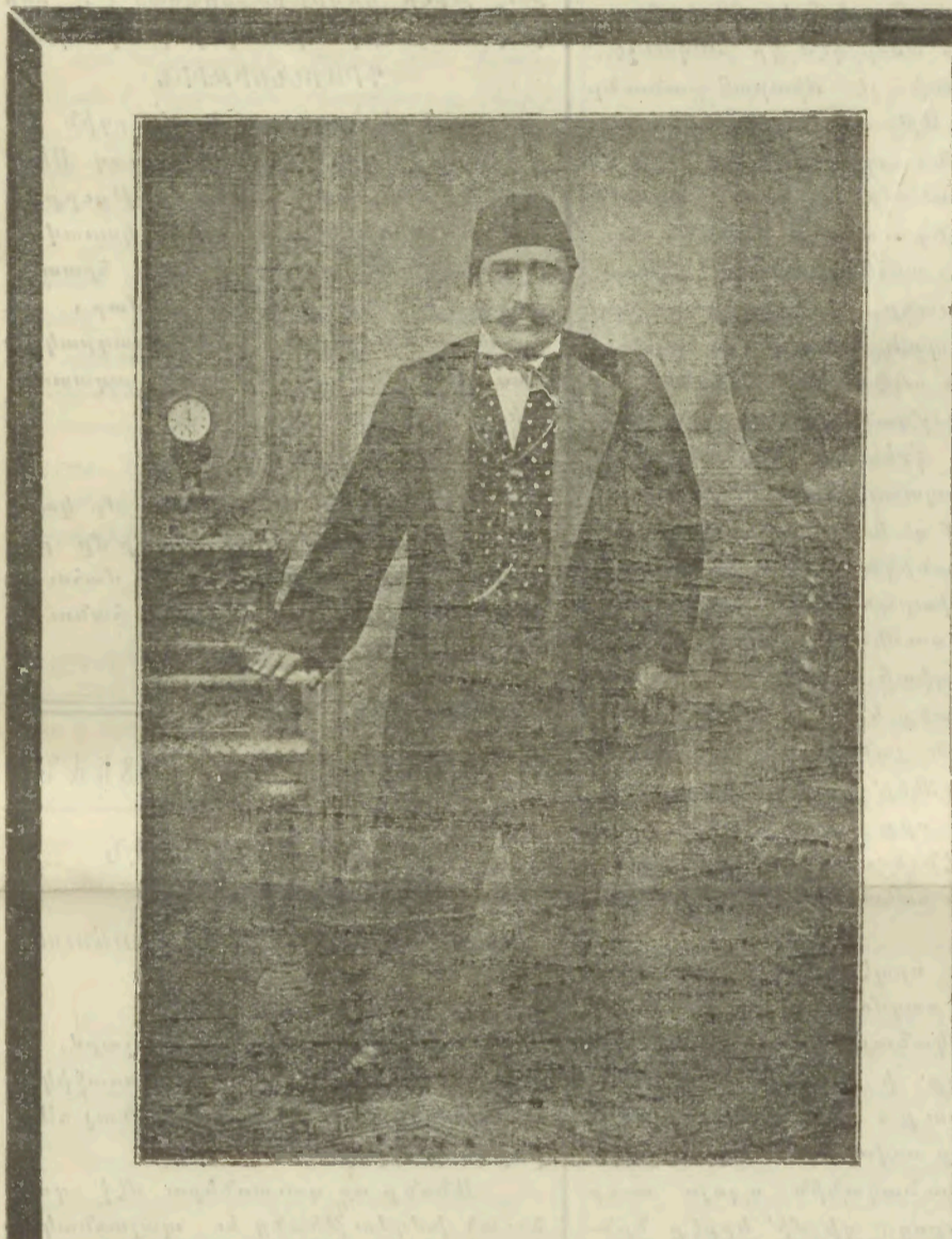
Լեւոնտար Կեօպրուհանը տնայնէլ՝ Օֆիցիոս անունով գրքին մէջ .

ՍԵՆԱՀԱՐՈՒՍ ԵՒ ԲԱՐԵՂՈՒՄ ԵԳԻՊՏՈՍԿԱՆ ԱՐԱԲԻԵՐՍԻ ՊՕՂՈՍ ԿԵՔԵՏԻՔ ԿԱՐԱՊՏԵՏԵԱՆ Մասնաւարտ Գեղարտ Եւրոպայի