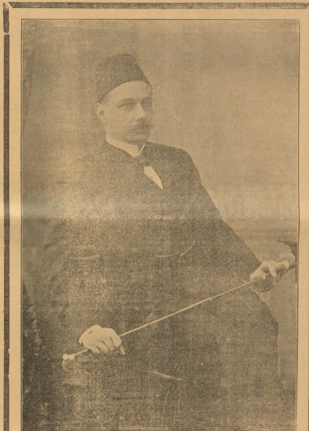
S. E. TIGRAN PACHA Տ. Ե. ՏԻԳՐԱՆ ԲԱՇԱ

« Պատիւ ունեցայ ստանալու Ձեր Սրբազնութեան Յուլիս 1 թուակիր հաղորդագրութիւնը, որով կը բարեհաճէք ինձի յինչն առ սա թագաւոր կայսեր զինել ձեր ամենազարգացած խնդիրը, ազգելու համար Օսմանեան կառավարութեան վրայ, որպէսզի մահմեդականներու բռնութիւններէն ազնուօրով թուրքացեալներու վիճակը բարւոյնի : Նորին կայսերական վեհափառութիւնը ինձի հարգելի պարունակութեան ծանօթանալով, բարեհաճեցաւ բարձրագոյն հրամայել ինձ. Ձեր Սրբութեան յայտնելու որ՝ Ռոսիոյ կառավարութիւնը իր կարգին, ձեր խնդրագիրը ըստանալէ առաջ ալ, ուղղորդութիւն գործադրած է թուրքիոյ սահմաններուն մէջ ապրող հայերու վիճակին վրայ : « Հաղորդելով ձեզի պատասխանը թուրքիոյ մէջ ապրող բոլոր քրիստոնէայ ժողովուրդներու բարձր հովանաւորին եւ պաշտպանին որով սրտին մօտիկ են Փոքր-Ասիական հայ ազգաբնակչութեան շահերը եւ որուն ամենազարգացած նախաձեռնութեամբ ամենախիստ միջոցներ ձեռք առնուած են հակահայկական յուզումները կանխելու. եւ հաստատուն յոյս ունիմ թէ՛ Պէրլինի Գաշնազիրը ստորագրող ազգութիւններու միտնաւորու ջանքերով խաղաղ եւ հանդիսաբար :