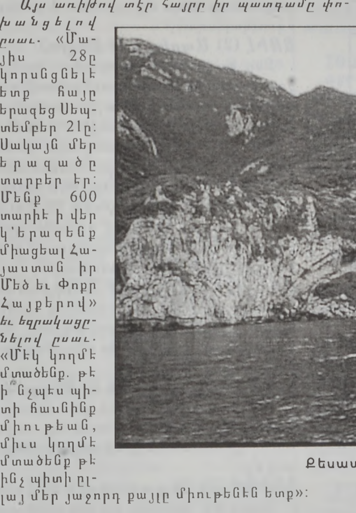
Քեսապի ծովափերեայ գօտի

Ամէն տարուան աւանդութեան համաձայն, Մայիս 28ին, Ս. պատարագէն ետք ժողովուրդը մեկնեցաւ Պատիթ, ծովափերեայ շրջան, օրուան խորհուրդով հարստանալու: Այս առիթով տէր հայրը իր պատգամը փոխանցելով ըսաւ. «Մայիս 28ը կորսնցնելէ ետք հայր երազեց Սեպտեմբեր 21ը: Սակայն մեր երազ Երազ Երազ Երազ էր: Մեր 600 տարիէ ի վեր կ'երգէր Վերջին Կարգը»: