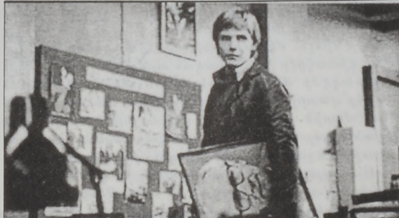
Մշակութային եւ կենցաղային փոփոխութիւններ՝ «Կուտ պայ, Լենին»-ի մէջ:

Եթերը արուեստի լիբրանանցի սիրահարներուն կողմէ մեծ ժողովրդականութիւն վայելող եւրոպական շարժապատկերի 10րդ փառատունը աշխուժօրէն կը շարունակէ իր տասնօրեայ ընթացքը՝ ներգրաւելով հանդիսատեսներու հոծ բազմութիւններ: Յատկանշական է նաեւ, որ փառատունը կը պահպանէ նախորդ տարիներու իր միջազգային մակարդակը՝ մատուցելով օրինակներ եւրոպական շարժապատկերի լաւագոյն նոր ժապաւէններէն, որոնք արժանացած են մակարդակաւոր մրցանակներու: