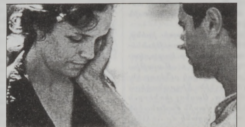
Անակնկալ կերպով Ափրիկէ հաստատուած գերմանացի-իրեայ ընտանիքի մը ողիսականը՝ «Նոուէր ին էֆրիթա» ժապաւէնով:

Անոնցմէ մէկ մասը արդէն իսկ արժանացած են միջազգային կարեւորագոյն մրցանակներուն: «Նոուէր ին էֆ-րիթա» (Քարոլին Լինը) եւ «Կուտ պայ, Լենին» (Ուոլֆլանկ Պեքըր) ժապաւէնները իրենց արժարժած հարցերով կը հետաքրքրեն բոլոր ժամանակներու հանդիսատեսները: Ուոլֆլանկ Պեքըրը, որ տիրացած է այս տարուան լաւագոյն օտար ժապաւէնի «Օսթրիա»-ն, կը պատմէ նացիներու հալածանքէն մազապուրծ փախուստ ստուած եւ Ափրիկէի տափաստաններուն անծայրութեան մէջ ապաստանած ընտանիքի մը վերականգնման գործը: «Կուտ պայ, Լենին»-ը, գերմանական բազմաթիւ ժապաւէններու նման ժամանակակից սրբաբանական լուսարձակի տակ առնելով ցեղային խտրականութեան գոհին կողմէ բնիկներուն նտարածման որդեգրած փառատունը քաղաքականութեան հեղանակէր: Իսկ այս տարուան լաւագոյն եւրոպական ժապաւէն ընտրուած «Կուտ պայ, Լենին»-ը, գերմանական բազմաթիւ ժապաւէններու նման ժամանակակից սրբաբանական լուսարձակի տակ առնելով ընտանիքի մը յարաբերութիւններուն մէջ: