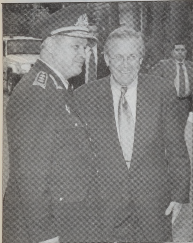
Ռամսֆելտ եւ Ապիե

Միացեալ Նահանգներու արտաքին գործոց նախարար Քոլին Փաուելը կոչ ուղղեց ՕԹԱՆԻ աւելի մեծ դերակատարութիւն ստանձնելու հրաքար մէջ՝ օժանդակելու համար երկիրին մէջ ապահովութեան վերահաստատման: