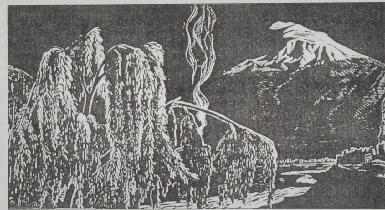
«Շայրենի ծով», գործ՝ Երազեայ Ռուսկեանի

Սայաթ Նովայի ծննդեան 250ամեակի յորեկեանին Հ. Ռուսկեանը ներկայացնում է դիմանկարի տարբերակը՝ փասթէլով: Մեծ երգչի ստեղծագործական կենսը, ինչպէս յայտնի է, անցել է Թիֆլիսում, ուստի եւ նկարի մէջ արտայայտուած բնաշխարհը՝ հեռուում ուրուագծուած Սեփեթի վանքը, այդ է պահարկում: Սայաթ Նովայի արտաքինի մասին որեւէ յիշատակութիւն չկայ, սակայն նրա անմահ երգերը այլ բան չեն ասում մեզ, քան այն, որ մեծ աշուղը համակրելի մարդ պիտի եղած լինի: Ռուսկեանի ստեղծած դիմանկարները ստացած տպաւորութիւնը իրողութեան ուժով հաստատում է Սայաթ Նովայի անձնաւորումը: Յօրինուած կերտում է կապուտի եւ վարդագոյնի կանաչախառն երանգաւորման համադրումը ու թեթեւակի ընդդժմմեքով, որն իր ամբողջութեամբ գարնանային շունչ է բուրուում, քնարականութիւն հաղորդում աշխատանքին: Պատահանից ներս թափանցած արեւի շողերով լուսաւորուած են դէմքն ու ձեռքերը, որոնք գոյնների թեթեւակի խաղի ու երանգաւորման զսպուածութեամբ արտայայտում են հոգեկան հարուստ ներաշխարհ ու որոշակի կենսահայեցողութիւն: