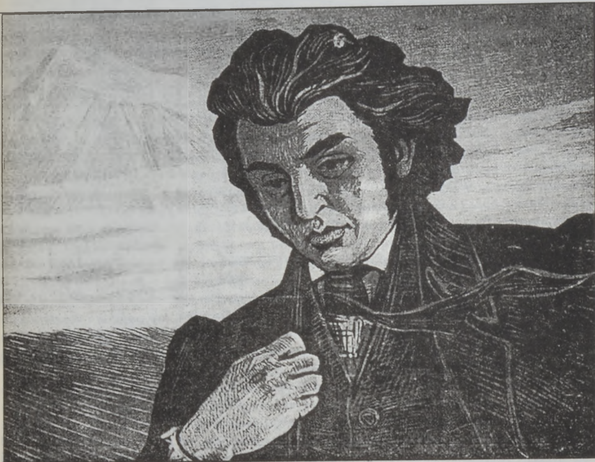
«Խաչատուր Աբովեան». գործ՝ Երազեայ Ռուսկեանի

Կատարողական ձեռքի առումով եւս դիմանկարչու թիւերը ունի իր տարատեսակները: Ամէնէն տարածուած եւ ամէնէն ընդունուած կերպը այն է, որ երբ գեղանկարիչը իր ներշնչումը կը ստանայ ուղղակի բնորոշ: Առաւել վարպետները կը նախընտրեն, որ բնորոշ շարժի, որպէսզի դիմանկարը աւելի շնչաւորուի եւ կենսունակ դառնայ: Երբ պատկերուող անձնաւորութիւնը մահացած է, արուեստագէտը կ'օգտուի անոր յուսանկարներէն: