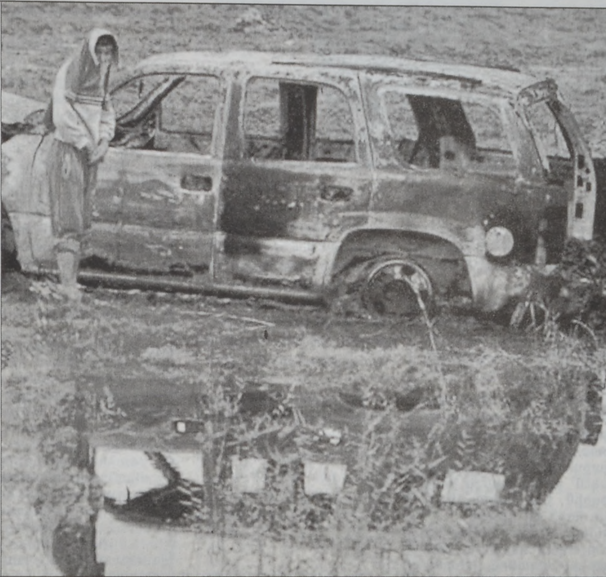
Սպանացի դիւանագետներ փոխարող ինքնաշարժը

Սպանական ուժերուն գաղտնի սպասարկութեան անդամ եօթը գործակալներ սպանուեցան Շաբաթ օր Պաղտատի չիլի ամբուստի վրայ: Սպանական ուժերը (1300 պիստոլ) կը գտնուին դէպի հարաւ տանող խաղաղ վայրերէն մէջ: Օտար լրագրող մը, որ միջադէպին վայրը հասած էր դաշնակից ուժերէն առաջ, ըսաւ, որ իսրայէլ մը իրաքցի պատանիներ ու երիտասարդներ իսրայէլի խմբիկներու շուրջ, Սատտամ Հիւսէյնը կը գովաբանէին, ինչպէս նաեւ կը կոխկոտէին դիակցութիւնը: Սպանացիները, որոնք երկու ինքնաշարժով կ'անցնէին, որ թակարդի մը մէջ առնուած են, երբ պիստոլներ արձակած են անոնց վրայ: Սպանիոյ պաշտօնատարներուն նախարար Ֆետայիբ Օրիլիօ յայտարարեց, որ շուտով Պաղտատ կը մեկնի տուն բերելու համար զոհերուն մարմինները: Իսկ վարչապետ Խոսէ Մարիա, որ