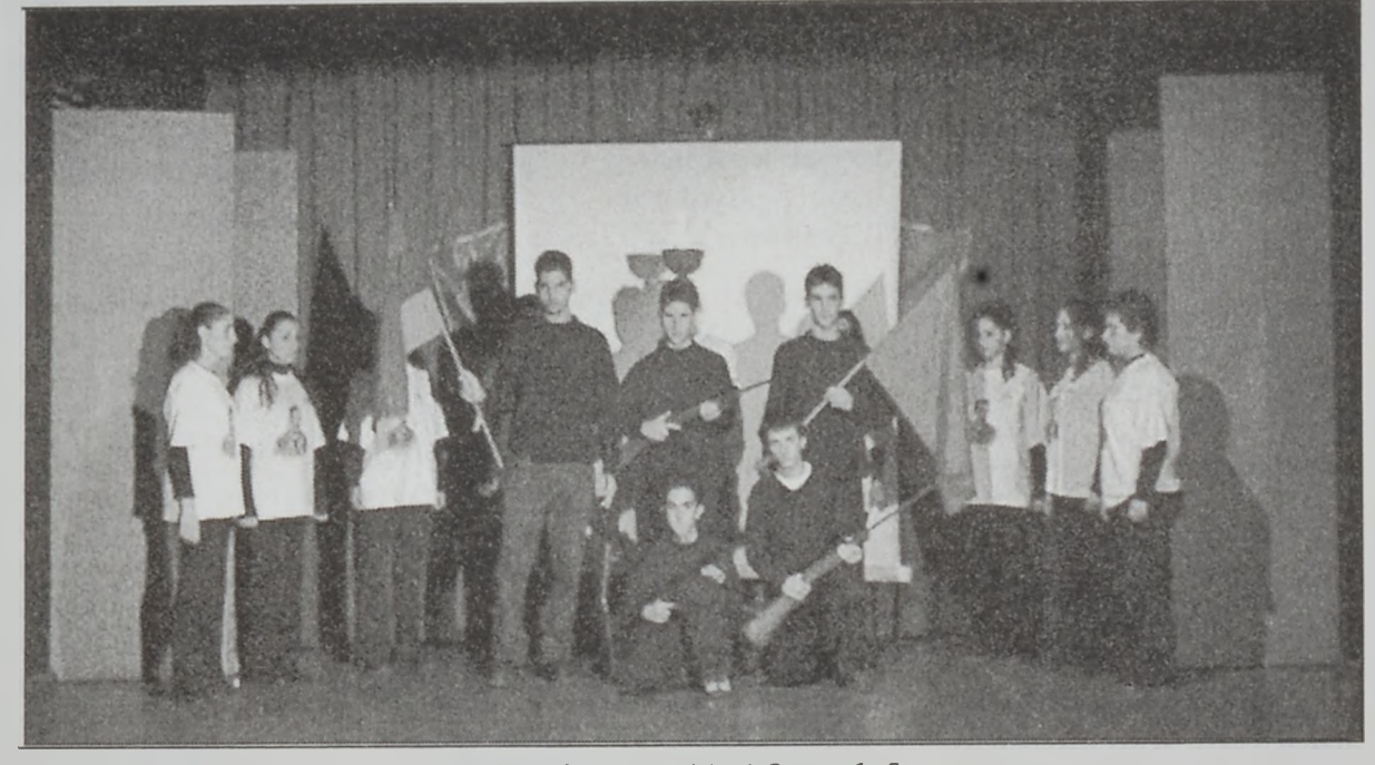
Կենդանի պատկերէն պահ մը

յուն կացութեան հետեւանքով պանակաւ վտանգներու դէմ յանդիման կը գտնուի եւ Հայաստանն ու Սփիւրքը պէտք է ամէն ձեւով գործեն այս ուղղութեամբ: