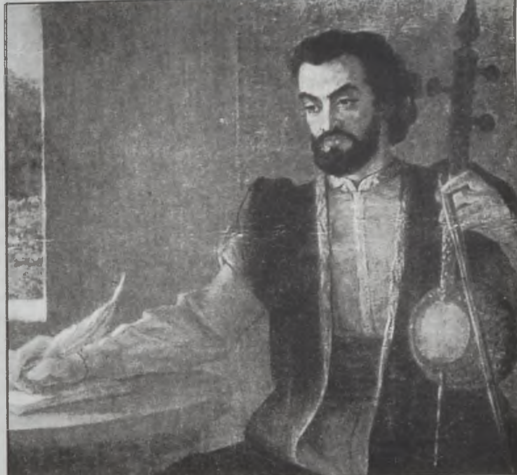
«Սայաթ Նովա». գործ՝ Երազեայ Ռուսկեանի

Բնական մեծութեամբ է կերպարուած Մեծնոպ Մաշտոցը՝ երկու ձեռքերի մէջ պահած մագաղաթեայ դիրքը: Նրա կեցողութեամբ աւանական է, ինքնապատահաբար մեծագործութեան գիտակցութեամբ ամբարայնուած: Առանձնապէս ակնառու է գունային եւ լուսային համադրութեանը նկարչի գործն միջամտութիւնը, որը եւ նպաստել է մտայնացման մարմնաւորմանը: Խառն շրջապատի մէջ թանձր գոյներով կանաչի ու կարմրի ներդաշնակ գուգոյրմամբ է ընդգծուած