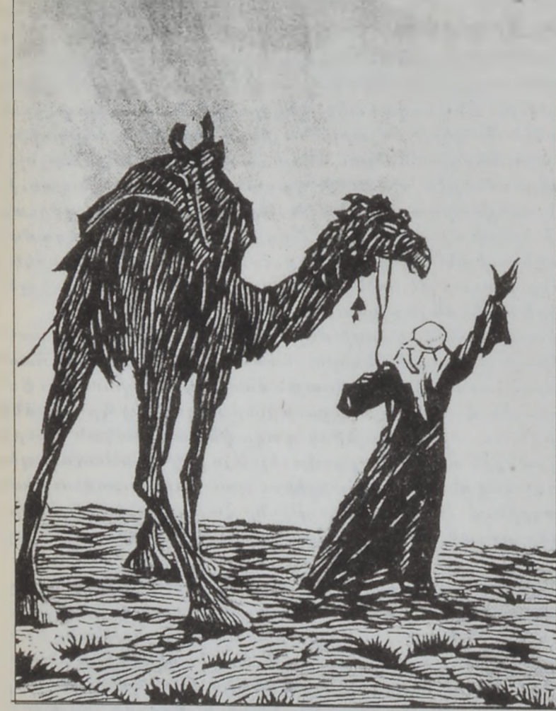
«Աբու Լալա Մահարի», գործ՝ Երազեայ Ռուսկեանի

նաւորութիւնը, որուն դիմանկարը պէտք է որ կերտէ: Հոս երբեմն օգնութեան կը հասնին անոնք, որոնք կը ճանչնային ենթակայան եւ կը նկարագրեն անոր դիմագիծերը: Յաջողութեան յոյսը բաւականին թոյլ է այս պարագային: Սակայն հարցը բոլորովին կը փոխուի, երբ խնդիրը կը վերաբերի պատմական անձնաւորութեան մը, մշակութային գործիչի եւ առհասարակ յայտնի դէմքի մը դիմանկարի ստեղծման: Հոս գեղանկարիչը աւելի գործունի պատկերուողի նկարագիրին եւ անհատականութեան հետ, քան՝ նմանութեան, որովհետեւ ոեւէ մէկը չէ տեսած ու չի կրնար յիշել զայն: Այնուամենայնիւ կան լայն ժողովուրդի երեւակայութեան մէջ: Այս պարագային երկրագործը պէտք է որ ուսումնասիրէ ու լաւագոյն ըմբռնէ պատկերուող կերպարի խառնուածքն ու նկարագրային գիծերը, որպէսզի կարենայ կերտել այնպիսի տիպար մը, որուն մէջ խտացուած ըլլայ տուեալ անձնաւորութեան ներքին «դիմագիծերը»: