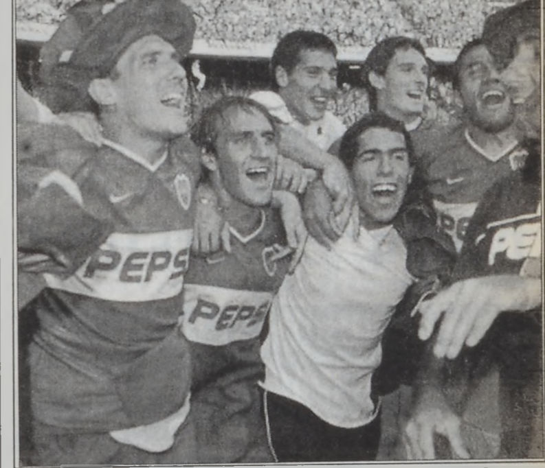
Պոքա ժունիորգի մարզիկները կը տօնեն իրենց յաղթանակը

Այս տարուան սկիզբը Հարաւային Ամերիկայի Լիպթաթաորէս բաժակը շահած Պոքա ժունիորգ անցաւ չարաթափերին շահեցաւ Արժանթինի ֆուտբոլի ախոյեանութիւնը (Ափերթիւրա), երբ 2-1 արդիւնքով պարտութեան մատնեց Արսենալը: