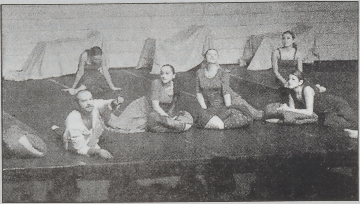
Տեսարան մը՝ «Էքուր, լա ռեսպիտաիոն տե մենուար»-էն:

Լ ի բ ա ն ս ն ց ի ֆրանսագիր բանաստեղծ Նատիա Թուէյնիի յիշատակին նուիրուած եւ անոր կեանքին ու գործերուն եւ յիբանանեան հանրութեան միջեւ մտերմութիւն մը առաջադրող պարային-թատերական ներկայացում մըն է «Էքուր, լա ռեսպիտաիոն տե մենուար»-ը, զոր բեմադրած են Լիւիս Ապիատ եւ Մէյ Օկտրն-Միիթ: Երկու արուեստագետները, որոնք վերջին երկու տարիներուն քանիցս բեկամանացուցած էին Նատիա Թուէյնիի բանաստեղծութիւնները, իրենց այս գործով բազմապատկապ յարուստեան կարողութիւնները ցուցնելու համար օգտուած են իրենց յարմարութիւնները: