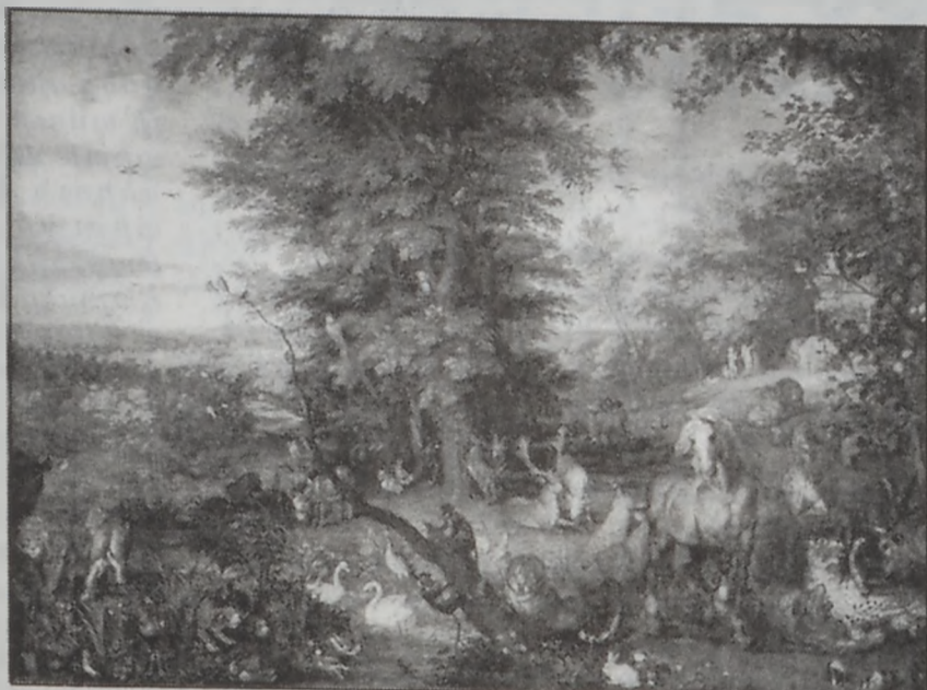
Պրիկել «Ադամն ու Եւան Եդեմական պարտեզին մէջ» գեղանկարը գծած է 1615ին: