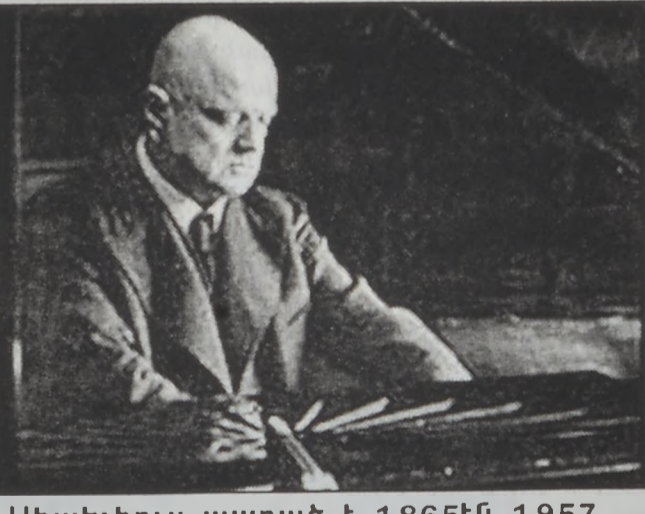
Սիպելիուս ապրած է 1865էն 1957

Ֆինլանտացի ազգային երաժիշտ Սիպելիուսի չորս երգերուն խաղաղութիւնները, որոնք կորսուած կը համարուէին, յայտնաբերուած են զրամատան մը նկուղին մէջ: Թէեւ խաղաղութիւններուն գոյութիւնը ծանօթ էր, սակայն կ'ենթադրուէր, թէ անոնք կորսուած էին, որովհետեւ ոչ մէկ արձանագրութիւն կար անոնց վերաբերելու: