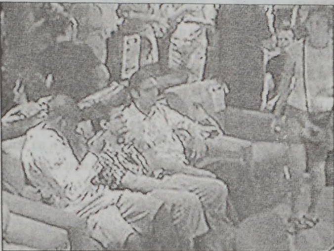
անոնք աւելի կարճատեւ էին եւ նոյնիսկ՝ աւելի աննպատակ:

Մարդիկ որոշ ժամու մը յանկարծ կը հաւաքուին նախապէս ճշդուած վայրի մը մէջ եւ ցրուին արագօրէն՝ շփոթի մատնելով զիրենք դիտողները: Անոնք անանուն ե-նամակով կամ բլիթային հաղորդակցութեամբ կը հրաւիրուին գինետուն մը, ուր ցուցմունքներ կը ստանան ամբողջ մը կազմելու, ապա ցրուելու համար: Կայծակնային արագութեամբ ստեղծուած ամբողջներու համացանցի կայքը կը բացատրէ. «Ամբողջը կը յայտնուի առանց նախազգուշացումի եւ կը ցրուի նոյնքան արագ, ձուկի վտառներու կամ թռչունի երամներու պէս»: