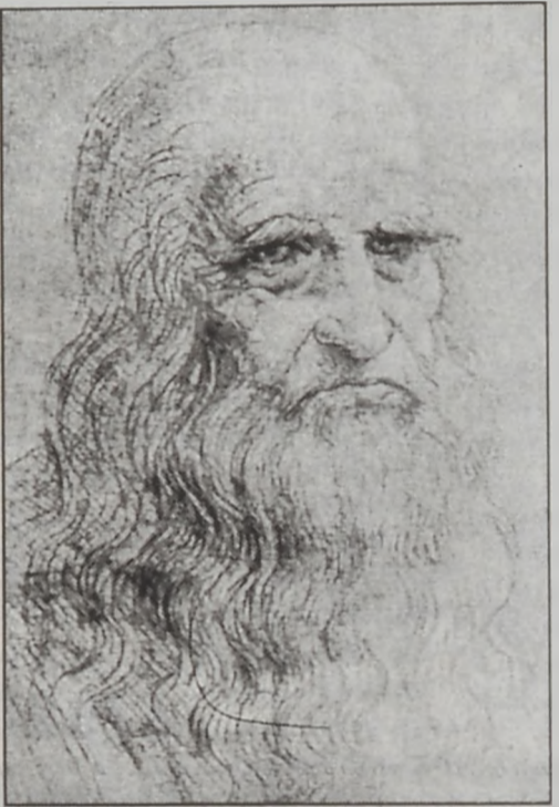
Տա Վինչի. «Ինքնանկար»

Վար ու երիտասարդ ստեղծագործողներու թով: Ի վերջոյ ինքնախարհում թեան կ'առաջնորդէ ամբարտաւանութեան, որ ինքնին ժխտական անդրադարձ կ'ունենայ թէ՛ անհատին եւ թէ՛ անոր շրջակայ տին վրայ: Իսկ ամբարտաւանութիւնը ոչ միայն սոցիալական կ'ենթարկուի, այլ նաեւ՝ կեանքի թերագնահատում, հետեւաբար նաեւ արժէքներու ժխտում: Իրաւ ինքն իր ուժերն ու կարողութիւնները ճիշդ գնահատող արուեստագէտն է, որ կրնայ ուղղորդել իր ստեղծագործական կեանքը եւ հասնի թարմունքներուն: Իրաւ եւ ինքն իր ուժերն ու կարողութիւնները ճիշդ գնահատող արուեստագէտը համեստ կ'ըլլայ, որովհետեւ, գիտէ, թէ արուեստը անհուն է եւ անհասանելի, հետեւաբար ինք որքան ալ տաղանդաւոր ըլլայ ու հանճարեղ, ան փոքր է արուեստի մեծութեան դիմաց: Վա՛յ այն արուեստագէտին, որ ո՛չ միայն կ'իյնայ, այլ նաեւ կը մնայ ինքնախարհում մէջ: