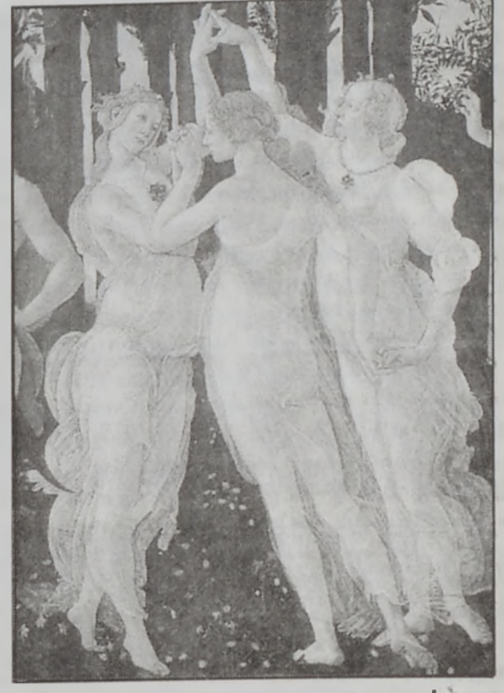
«Գարուն» (դրուագ) գործ՝ Սաւոարո Պոթիչելիի

Վար ու երիտասարդ ստեղծագործողներու թով: Ի վերջոյ ինքնախարհում թեան կ'առաջնորդէ ամբարտաւանութեան, որ ինքնին ժխտական անդրադարձ կ'ունենայ թէ՛ անհատին եւ թէ՛ անոր շրջակայ տին վրայ: Իսկ ամբարտաւանութիւնը ոչ միայն սոցիալական կ'ենթարկուի, այլ նաեւ՝ կեանքի թերագնահատում, հետեւաբար նաեւ արժէքներու ժխտում: Իրաւ ինքն իր ուժերն ու կարողութիւնները ճիշդ գնահատող արուեստագէտն է, որ կրնայ ուղղորդել իր ստեղծագործական կեանքը եւ հասնի թարմունքներուն: Իրաւ եւ ինքն իր ուժերն ու կարողութիւնները ճիշդ գնահատող արուեստագէտը համեստ կ'ըլլայ, որովհետեւ, գիտէ, թէ արուեստը անհուն է եւ անհասանելի, հետեւաբար ինք որքան ալ տաղանդաւոր ըլլայ ու հանճարեղ, ան փոքր է արուեստի մեծութեան դիմաց: Վա՛յ այն արուեստագէտին, որ ո՛չ միայն կ'իյնայ, այլ նաեւ կը մնայ ինքնախարհում մէջ: