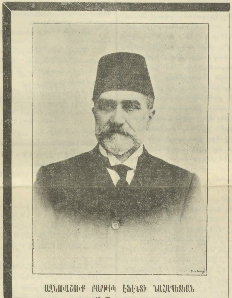
ԱԶՆՈՒՆՈՒՄԻՔ ԲԱՐՔԻԿ ԷՖԷՆՏԻ ՆԱՀԱՊԵՏՆԱՆ

տիրէ . . . Իսկ այս աշխարհին մէջ ինձի պէս շատեր եկեր ու գնացեր են, ինչպէս նաեւ անդիմենքուն պէս ալ շատեր միեւնոյն ուղիէն անցած են . . . աշխարհը աշխարհ ըլլալէն ի վեր . . . :