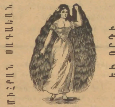
ՇԵՐԱՍ ԱՊՏ - ԷԼ - ՈՂԻՉ ԹԻՒԻ 5

ԱՐԳԱՍԱՒՈՐՈՒԹԻՒՆ Հեղինակ ԷՄԻԼ ՉՕԼԱ Թարգ. ԵՐ. ՕՏԵԱՆ Հրատարակելու է և գնելու համար պէտք է դիմել Կ. Պոլիս Չարգարեան կղզայ Կրատունը: