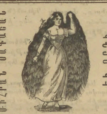
ՇԱՐԱ ԱՂՏ - ԷԼ - ԱՉԻՉ

Հրատարակուելու է Է. Գեորգի Համար պէտք է դիմել Կ. Պոլիս Զարգարեան եղբայր Գրատունը: