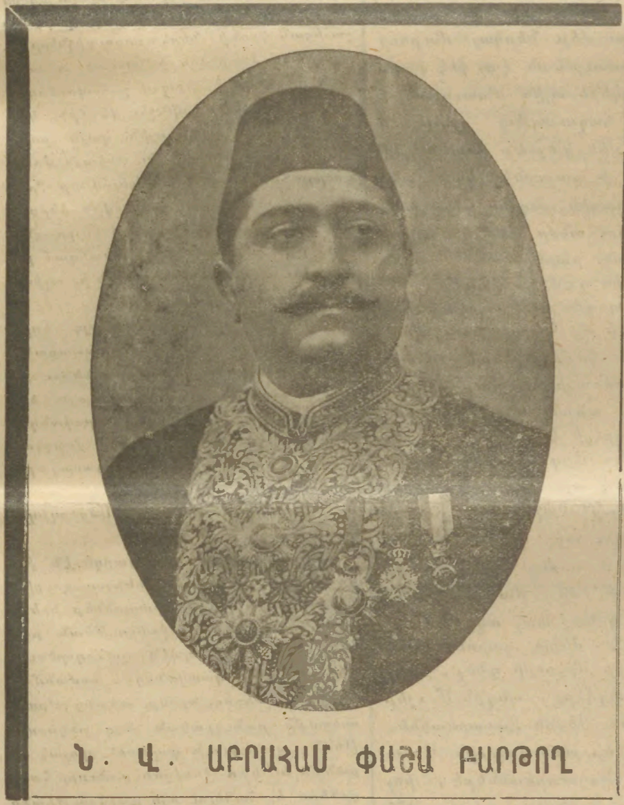
Ն. Վ. ԱՐՁԱՆՈՅՄ ՓԱՅՄ ԲԱՐՁՈՂԻ

ԱՆԿԱՒ ՀԱՅԱՐԹԵՐԹ. Արտակալ եզրակարգ կառավարութեանը, Հասար 28 Հրահանագրով. —ՅԼ ԿԸ ՀՐԱՏԱՐԱԿՈՒԻ ՉՈՐԻՔԱՐԹԻ ԵՒ ՇԱՐՔՈՐ ԵՐԵՐԸ —