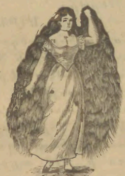
ՇԱՐԱ ԱՊՏ - ԷԼ - ԱՁԻՉ Թիւի 5

ԱՐԳԱՍԱՌՈՐՈՒԹԻՒՆ Հեղինակ ԷՄԻԼ ԶՈՒԱ Թարգ. ԵՐ. ՕՏԵԱՆ Հրատարակ ելած է և գնելու համար պէտք է գրիւթ Կ. Պոլիս Զարգարեան հրատարգ Գրատունը .