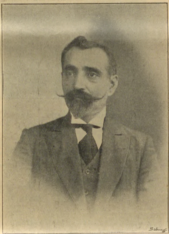
Ե Ղ Ի Շ Է Թ Ո Ր Ո Ս Ե Ա Ն ՀԻՄՆԱԳԻՐ, ՏԵՐ ԵՒ ՎԱՐԻԶ «ԱՐՇԱՒՈՅԻՆ» ԼՐԱԴՐԻ

ՏԱԿԱՆԱԿԱՆ ԳՐՈՒԹՅՈՒՆ -40- ԵՆԻՊՈՍՏ Քարկան 40 Եգ. սոյ Վեցամսայ 20 ԱՐՏԱՍԱՀԱՆ Քարկան 12 1/2 Ե. Ապտիկ բաժանորդագրութիւն չի ընդունուիր . ԱՐՇԱՒՈՅԻՆ պարտաւոր ի Պոստ Կլ Խալի, Կառավարչատան մօտ, բաց Լ. Արաւոսեան ժամը 7 ԼԵ 12, խիկիւ օրէն յետ ժամը 2 ԼԵ 7 ր .