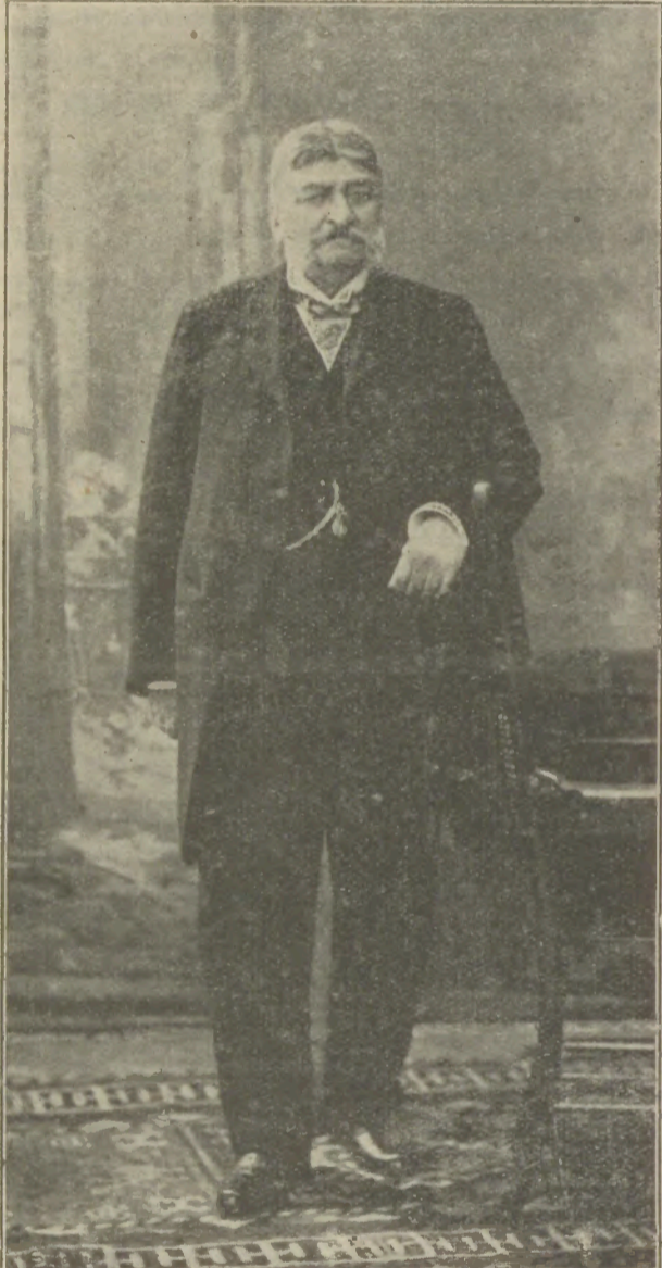
ԱԶՆ. ԳՐԻԳ. Ր. ԷՅԷՆՏԻ ԵՂԻՍԱՆ (ԳԼՆՁԵԼԻՐ) Յես մահուան խիստ կարեւոր կցակ մը թողած է:

Վերջին մեր քանի մը քննադատական թղթակցութիւնները՝ մաս նաւորապէս Ռումանա-հոյոց տղեղ բարբերն ու վարբերը մատնանշող տեղի տուածէ՛ ինչպէս կ'երևի ու կը հաւատաւորի մեզ, կարգ մը թիւրի մացութիւններու ունեց կամ աւելի ճիշտ կըլլայ ընել. . . տեսակ մը գիրազգածներու կողմէ, որոնք առանց գանձ կարենալ զանազանելու անձնականութիւնը ազգայնութենէն, ֆոյշ պոռնախ - ինչպէս ըսեր պիտի աւսիկ պառաւ մը, ինչպէս չեն վարանիր վարենայատուկ ու անվայել