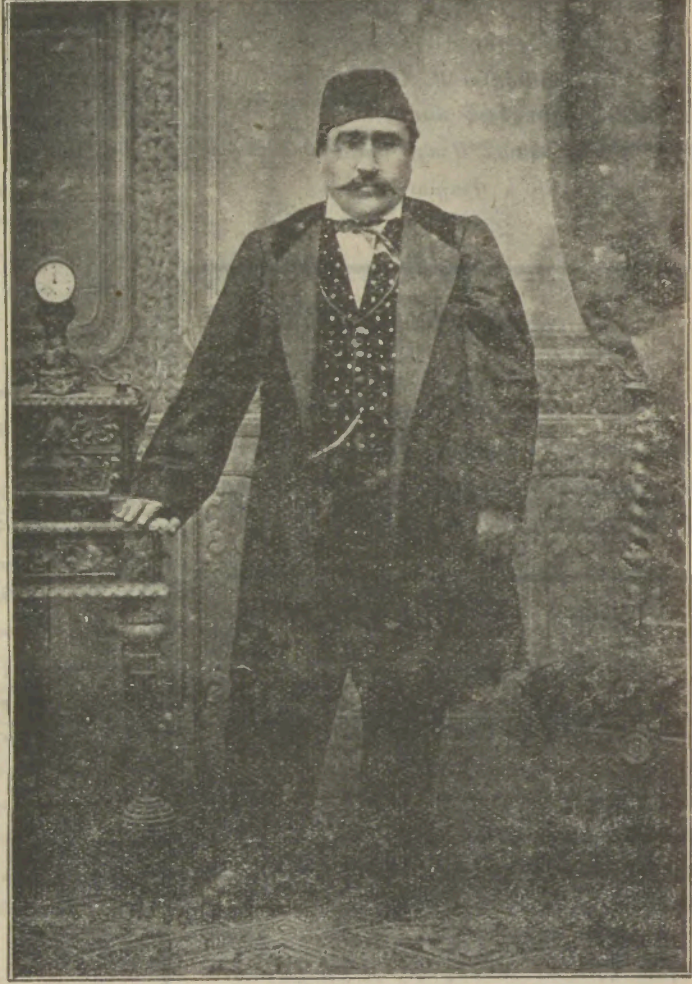
ԱԶՆ . ՊՈՂՈՍ ԷՅԷՆՏԻ ԿՈՂՈՍՏԵԱՆ

Եւ Դուք, Վսեմափայլ Տէր, առլցեալ հայրենասիրական և մարդասիրական մաքուր զգացմամբ, նրբերեցիք յընթացս հնգետասան ամսոց զանձն Ձեր, և շնորհիւ բարձրահիշակութեան և հոգեկան կարողութեան Ձերոց, յաջողութեամբ