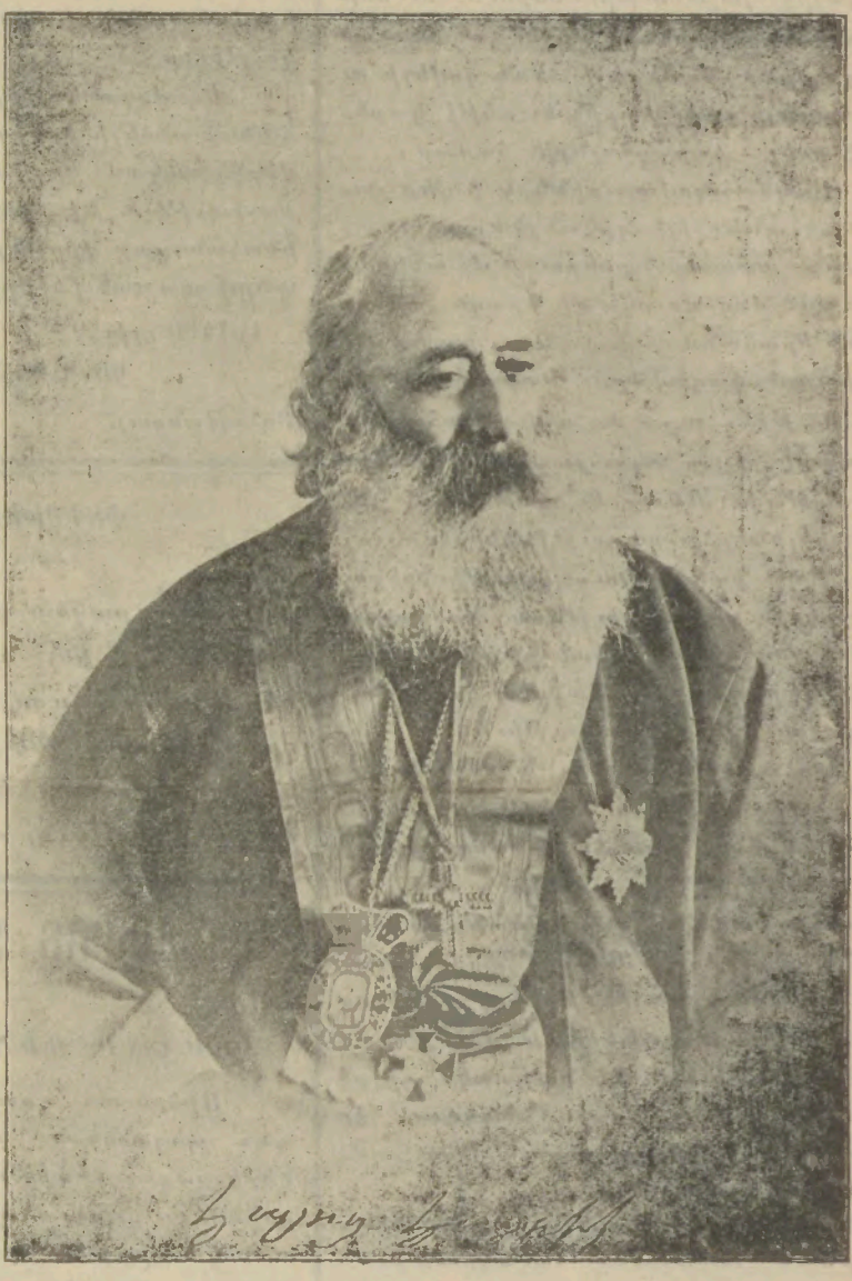
ՀԱՆԳՈՒՅԵԱԼ ՎԵՂ. ԿԱՌՈՂԻԿՈՍ, ՀԱՅՈՑ ՀԱՅՐԻԿ

Ա. Պալեան էֆէնտի իր բոլոր փիլիսոփայական տաղանդը ու կարողութիւնները ի սպաս դրաւ « անբարոյականութեան սահմանները » գրեթե - ճշդելու պայքարին, բայց ասոնց ամէնն ալ ապարդիւն անցան : Հարցը կնճռոտ էր՝ իսկ պատասխանները անբաւական եղան, մանաւանդ որ՝ այդ թեզը պաշտպանելու ամենածանր զբաղումը Պատ. Հոգաբարձուին կողմէ յանձնուած էր դեռատի աղջկան մը... Հետեւաբար՝ անբարոյականութեան սահմանները կը կարծուին ըլլալ և են : Արեւելքէն՝ տգիտութիւնն ու անկրթութիւնը, Հարաւ - Արեւելքէն՝ կեղծաւորութիւնն ու օրինազանցութիւնը, բուն Հարաւէն՝ խաբէութիւնն ու ոճրամտութիւնը, Արեւմտեան Հարաւէն՝ ազահուութիւնն ու բխախոհութիւնը, Բուն Արեւմտքէն՝ նորելուկ կուսակցամոլութիւնն ու անոր յուսի հետեւանքները : Արեւմտեան Հիւսիսէն՝ Դիւրահաւանութիւնն ու կարգ մը նախապաշարուածներ : Բուն Հիւսիսէն՝ չահախոհութիւնն ու զեղծարարութիւններ : Հիւսիսային արեւելքէն՝ նիւթական և բարոյական սնանկութիւնը, ասոնց վրայ կարելի է աւելցնել ընտանիքի՝ և զաւակաց տէր հայերու այն անուրակելի ընթացքը, որուն բողոքածութիւն կրնանք ըսել, և որուն դէմ բնաւ արդարացում կարելի չէ գրտնել, որովհետեւ այս ախտանիշերը ցոյց տուող անհատներուն վրայ ամեն տեսակ ոճիր և աղտոտութիւններ պէտք է փնտռել... ԿՈՐԱՔԱՄՍԿ