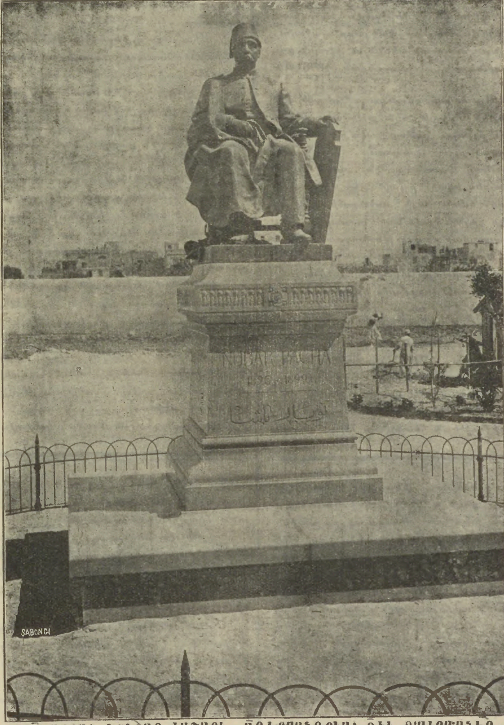
ՅՈՒՇԱՐՁԱՆ ՆՈՒՊԱՐ ՓԱՇԱՅԻ. ԱՂԷՔՍԱՆԴՐԻՍ՝ ՌԻՒ Տ'ԱԼԸՄԱՆԵՐ

Ասոր առաջին տպագրութեան արդիւնքը Հեղինակէն նուիրուեցաւ Գահիրէի Աղքատախնամ Ընկերութեան, ուրկէ բաւականէն աւելի