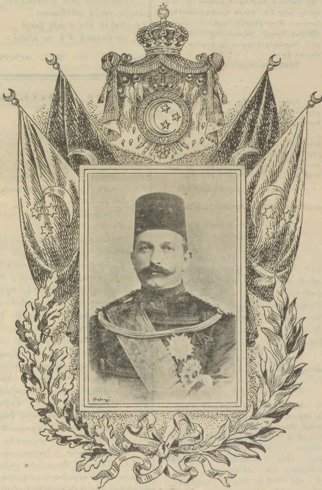
Ն. Բ. ԽՏԻՎ ԱՊՊԱՍ ՓԱՅԱ ԻԼՄԻ Բ.

S. A. ABBASY HILMY II. L'AUGUSTE SOUVERAIN D'EGYPTE