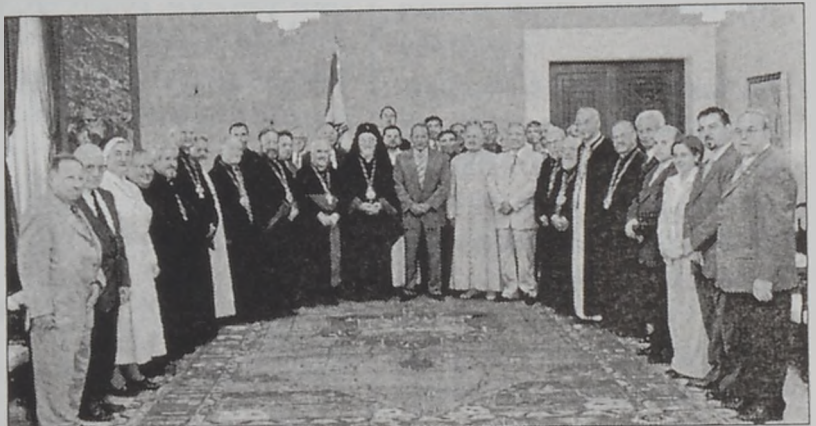
Առաջնորդութեամբ Ամենապատի է գե-րերջանիկ Ներսէս Պետրոս ԺԹ. կաթողի-կոս պատրիարքին կա-թողիկէ հայոց, Հայ Կա-թողիկէ Եկեղեցւոյ Սինհոլոզի եւ Պատ-րիարքական Բ. Համա-գումարի բազմադաս վա-տուիրակութիւն մը, Երկուշաբթի, 1 Սեպտեմբեր 2003ին, կէսօրէ առաջ ժամը 11:00ին այցելեց հան-րապետութեան նա-խագահ Կորապար Էմիլ Լահուտի, Պատա-տայի նախագահական պալատ:

Այս առիթով արտա-սանած խօսքին մէջ, ամենապատի հոգեւոր տէրը վերա-հաստատեց հայ հա-մայնքին հաւատար-մութիւնն ու կառա-ճութիւնը Լիբանանին, այնպէս ինչպէս կը թե-լաղրեն իրեն իր յուսա-ւորչեան քրիստոնէա-կան հաւատքն ու Սուրբ Աւետարանը եւ որ կը մտնէ շրջագծէն ներս Լիբանանի իրա-յատուկ կոչումին՝ հիմնուած համայնք-ներու միջեւ համակե-ցութեան, քաղաքակր-թութիւններու, մշա-կոյններու, կրօնքնե-րու եւ պղծերու միջեւ երկխօսութեան եւ հանդիպման վրայ: