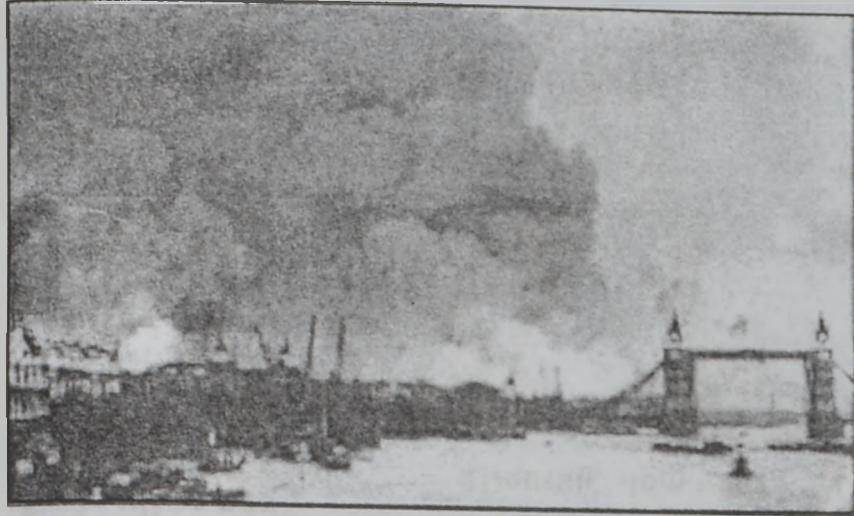
Լոնդոնի Երկրագործական ճարտարապետական թանգարանը:

ԳԵՐՄԱՆԱՅԻ ԳՐԱԳԷՏՆԵՐՈՒ ՆՈՐ ՍԵՐՈՒՆԴ ՍԸ ԿԸ ՇՈՒԱՆՑ Բ. ԱՃԽԱՐԿԱՄԱՐՏԻ ԵՒ ՈՂՋԱԿԻՉՈՒՄԻ ԲՆԱԲԱՆՆԵՐԵՆ՝ ԶԱՐԳԱՑՆԵԼՈՎ ԳՈՅՈՒԹԵՆԱՊԱՇՏ ԳՐԱԿԱՆՈՒԹԻՒՆ ՍԸ, ՈՐ ԽԱՈՆ ԸԱԿԱԶԴՅՈՒԹԻՒՆՆԵՐ ԿԸ ՍՏԵՂԾԷ: «ՏԸ ՆԻՒ ԵՈՐԵ ԹԱՅՄՁ» ԿԸ ԳՐԷ.