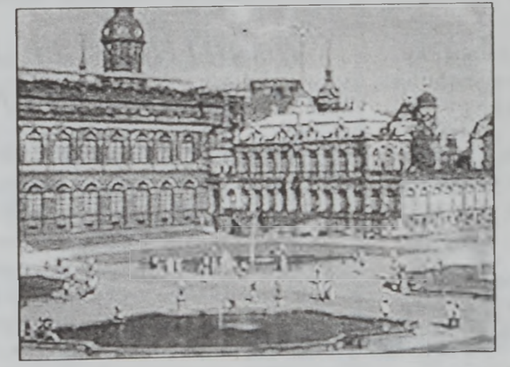
Գերմանիոյ հրաշքը վերջ գտած է: Պարոք ժամանակաշրջանի գեղեցիկ քաղաքներն Տրեստնի մէջ արուեստները իրենց մահուան սնարին մէջ են: