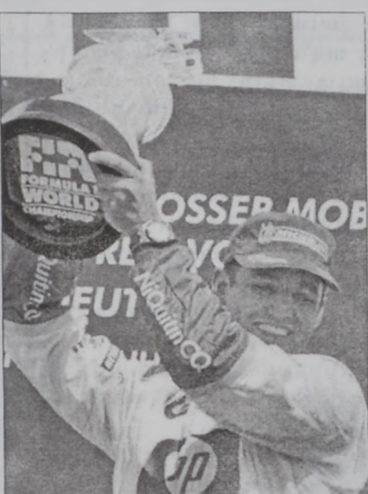
Մոնթոյա՝ իր շահած բաժակով

Ֆորմիւլա 1 2003ի աշխարհի ախոյեանութեան 12րդ կրան փրին, որ տեղի ունեցաւ երէկ՝ Հոբընհայմի մէջ (Գերմանիա), վերջ գտաւ քոլումպիացի Խուան Փապթո Մոնթոյայի յաղթանակով, որ այսպիսով այս տարուան ընթացքին իր երկրորդ յաղթանակը արձանագրեց: Ան արձանագրեց 1 ժամ 28 վայրկեան եւ 48 երկվայրկեան արդիւնք մը: