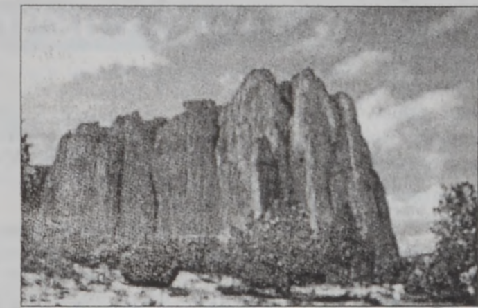
Էլ Սօրոյի ժայռերը. «25 տարի տեւեց, մինչեւ որ հասկնամ, թէ ճիշդ ի՛նչ պատահած է», կ'ըսէ հմազտ Լըպլան, ակնարկելով այս ժայռերուն շուրջ հրկիւզուած բնակավայրերուն:

«Մարդիկ փորձած են գիտնալ այս աշտարակներուն ծագումը: Ոմանք կարծած են, թէ անոնք շտեմարաններ են, ուրիշներ՝ աստղադիտարաններ: Անոնք կառուցուած են ճիշդ այն ժամանակներուն, երբ էլ Սօրոյի ամրոցը բարձր