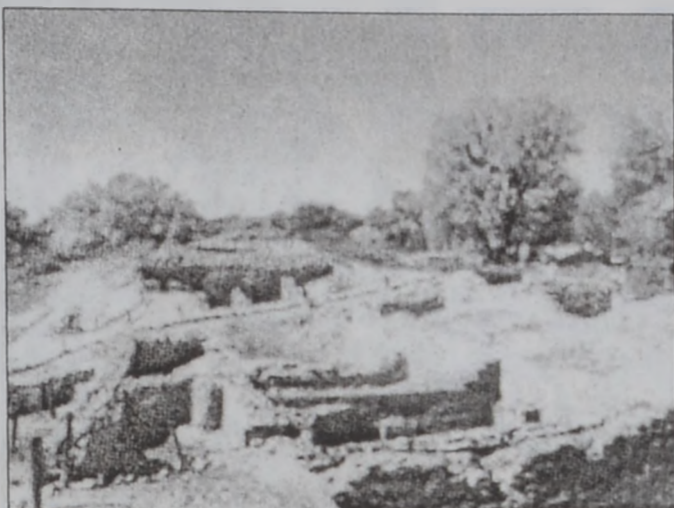
Սալւմը Ռուսիոյ Ամերիկայի բնիկներուն խիտ սենեակները բաղկացած գիւղերն էր: Շատեր կը ժխտեն, թէ արիւնակի պատերազմ մը մղուած է այստեղ:

Հաւանաբար արչաւողնները քնացած գիւղին վրայ յարձակած են արեւածագին: Բազմաթիւ գինուորներ անապատային սառն օդին մէջ ծագող արեւուն նման անձայն մագլցեցան բազմաթիւ եւ խիտ բնակարաններուն տափարակ երդիքները: Գիւղին 150 սենեակները ոչ պատուհան ունէին ոչ ալ դռներ, որոնք կը բացուէին գետնայարկին վրայ: Երդիքին մէջ կար ծակ մը եւ անոր յենած աստիճան մը, որ իւրաքանչիւր բնակարանի միակ մուտքն էր ու ելքը: Արչաւող գինուորները անմիջապէս դուրս քաշեցին աստիճանները, թակարդի մէջ ձգելով բնակիչները: Ապա անոնք վառեցին հնդկական հաղարջի իւրտուր ու գիւրավառ ճիւղեր եւ բոցավառ ծրարները նետեցին սենեակներուն մէջ: Զինուորները հետզհետէ ուռճացող կրակին վրայ նոր փայտաւեցուցին: Ոմանք գիւղին պատերուն վրայ չորցող կարմիր կծու պղպեղի տրցակները քաշեցին եւ նետեցին դժոխային կրակին մէջ, ստեղծելով ծուխ մը, որ արցունքաբեր կազի նման կ'այրէր աչքերը: Շուտով բոցերը հասան երդիքներուն գերաններուն, եւ յարձակողները պէտք էր տանիքներէն ցատկէին նախքան անոնց փուլ գալը: Գիւղին տարածքին բոլոր երդիքները փուլ կու գային բնակարաններուն մէջ, լուռութեան մատնելով ներսէն լուռող ճիւղերը: