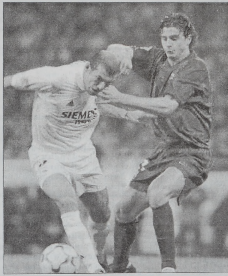
Կը գտնուի Մեքսիքո, ուր Պրպօլի շապիկով իր մասնակցութիւնը կը բերէ Քոնքաքաֆի «Կոլտ Բաֆ»ի մրցաշարքին:

Նշենք, որ Մոթթա 16 տարեկանին միացած է Պարսէլոնայի եւ բարձրագոյն դասակարգի իր առաջին մրցումը կատարած 2001ի Հոկտեմբերին: Ան այս օրերուն