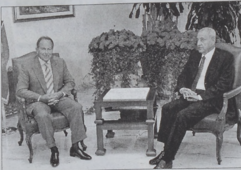
Նախագահ Կ. Ըմիլ Լահուտ երէկ ընդունեց խորհրդարանի նախագահ Նեպիի Պըրրիին:

Նախագահ Կ. Ըմիլ Լահուտ երէկ ընդունեց խորհրդարանի նախագահ Նեպիի Պըրրիին, որուն հետ քննարկեց երկրին ընդհանուր կացութիւնը եւ ներկայ շրջանային իրադարձութիւնները: