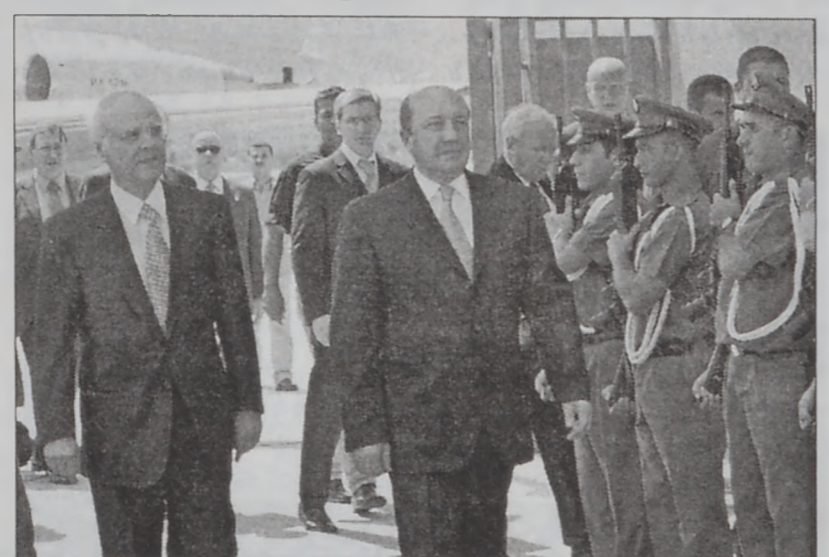
Իուծումը՝ բանակցութեանց ճամբով:

Իր կարգին, Իվանով քննարկեց Լիբանանի կեցումը Իրաքի իրադրութիւններուն նկատմամբ եւ ըսաւ, որ Իրաք ամէն իրաւաստութիւն ունի ընտրելու իր ղեկավարները, այլ խօսքով՝ օրինական ներկայացուցիչները, խնդրելով ՄԱԿի օժանդակութիւնը, որպէսզի Իրաքի ժողովուրդը ժողովրդավարութեամբ արտայայտուի երկիրը յուլող բոլոր հարցերուն եւ տագնապներուն շուրջ: