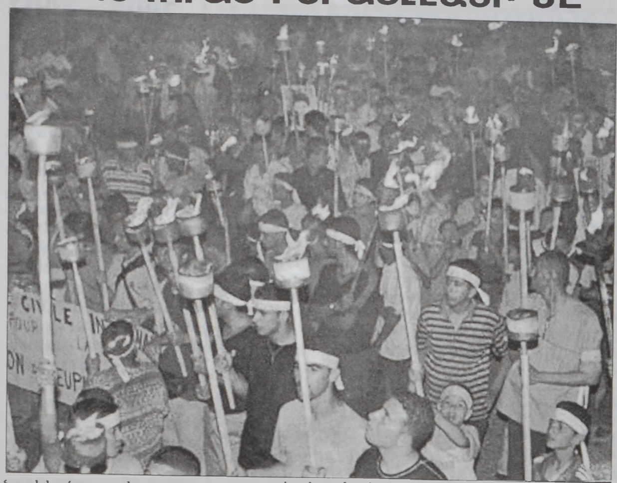
Նուրի մը, որ խոստովանած է, թէ նշանածին հետ մեղսակցած է առեւանգումի գործողութեան: Անկէ ետք է,

Իսրայելեան ապահովութեան աղբիւրներ հաղորդեցին, որ հետաքննութիւններուն լոյսին տակ յաջողած են ձերբակալել պաղեստինցի պարմա-