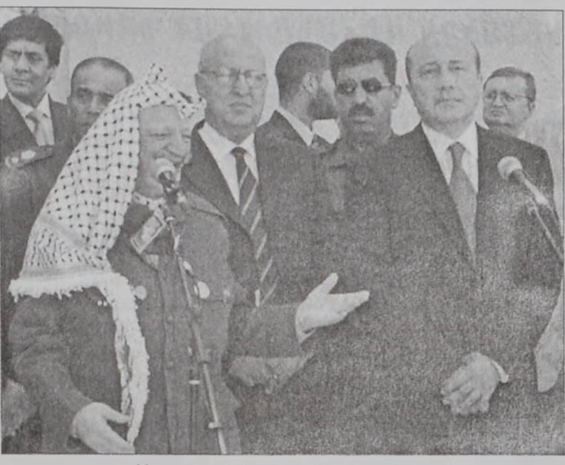
Արաֆաթ կ'ընդունի Իվանովը

Ռուսիա կը պահանջէ արագ կիրարկումը խաղաղութեան ճամբու քարտէսին, որուն հովանաւորներն են Անկուստը: Խօսելով Շարոնի եւրոպական երկիրներ շրջապտոյտին մասին, արտաքին գործոց նախարար Սիլվիո Շալոմ ըսաւ, որ Իսրայէլ - Եւրոպական Միութիւն կապերունորհանգրքուն մը սկսած է: Ան աւելցուց, որ դրական մթնոլորտ մը կը տիրէ փոխ յարաբերութիւններուն մէջ, որ կը նմանի «մեղրալուսինի»: Շալոմ ըսաւ նաեւ, որ եւրոպացիները կը գիտակցին, որ եթէ գործածուի նշանակալի դերակատարութիւն պիտի ունենան պաղեստինեան իսրայէլեան բանակցութիւններուն մէջ, պէտք է որ դեգրեն հաւասարակշռուած մօտեցում մը: Իսրայէլացի պաշտօնատարներ յաճախ ամբաստանած են եւրոպական երկիրները իբրեւ կողմնակալ՝ ի նպաստ արաբներուն: