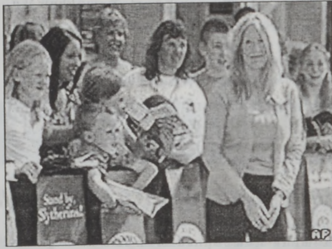
Երի Փոթերի արկածախնդրութիւններուն սկզբնական հեղինակը՝ Ռոուլինկ

Աւստրալիոյ մէջ քրիստոնէական եօթներորդ օրու ան կայստական 60 դպրոցներ 2001ին արգի-