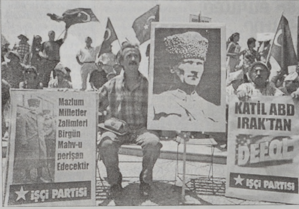
Թուրքերը կը բողոքեն

Միջադէպը տեղի ունեցաւ Ուրբաթ երեկոյեան: Աւելի քան հարիւր ամերիկացի պինուորներ ներխուժած են Սիւլէյմանիէի մէջ թրքական մասնաւոր ուժերու կեդրոն մը: Չինուորները կտրած են հեռաձայնի թելերը եւ ապա՝ ձերբակալած են 11 սպաներ եւ պինուորներ, զորս Քերքուք փոխադրած են: Ըստ «Հիրրիէթ» օրաթերթին ամերիկեան ուժերու տեղեկութիւններ հասած են, թէ թուրք պինուորները յարձակում մը կը ծրագրեն Քերքուքի կառավարչին դէմ: Մինչեւ երէկ ձերբակալուածները տակաւին ազատ չէին արձակուած: Անգաւրայի ամերիկեան դեսպանատան դիմաց հարիւրաւոր թուրքեր բողոքի ցոյց մը կազմակերպեցին՝ պահանջե-