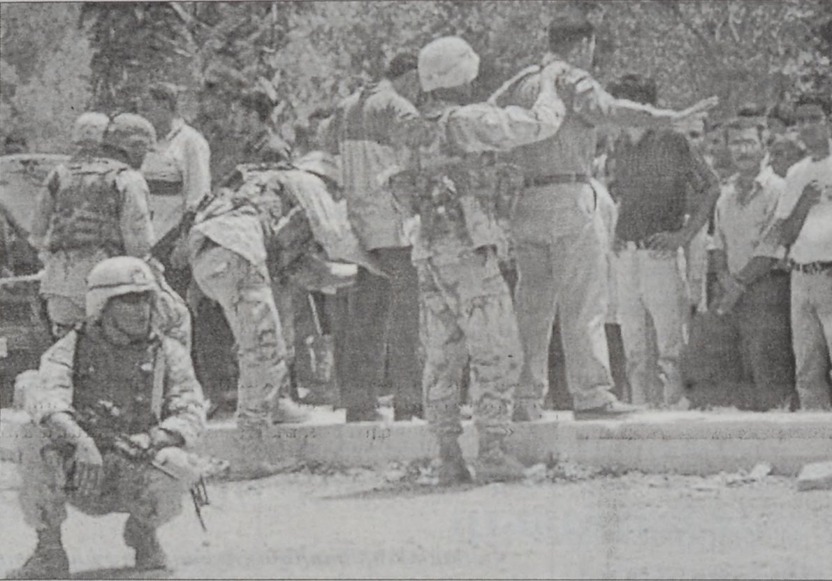
անգամ անմեղ իրաքցիներուն դէմ եղած է: Ան շեշտեց սակայն որ այս բոլոր արարքները որեւէ ձեւով պիտի չազդեն անբերկեան ուժերուն ներկայութեան եւ առաքելութեան, որոնք պիտի շարունակուին: Պրեմըր յայտարարեց նաեւ, որ Սատտամը եւ անոր իշխանութիւնը անվերապարձ կորստուած են, իսկ եթէ Սատտամ ողջ է, անպայման պիտի ձերբակալուի:

սպանութիւնը տեղի ունեցաւ Ռամատի քաղաքին մէջ, որուն ոստիկանապետը յայտնեց, որ ոստիկանները կ'ամբողջացնէին մարտնչի երրորդ օրը, երբ պայթուած տեղի ունեցած է համակարգիչներու կեդրոնին դիմաց՝ ոստիկանատան կից: Ոստիկանապետը ըսաւ, որ եօթը փոհերուն կողքին ինկած են աւելի քան 45 վիրատուներ: Անբերկեան պիւնուորական աղբիւրները սակայն յայտնեցին, որ 13 վիրատուներ արձանագրուած են: Իրաքի մէջ անբերկեան քաղաքային իշխանութեան ղեկավար Փօլ Պրեմըր դատապարտեց արաբը: Ան ըսաւ, որ Սատտամի հետեւորդներն են պատասխանատուները այս անարգ արարքներուն: Պրեմըր աւելցուց, որ հարուածը այս