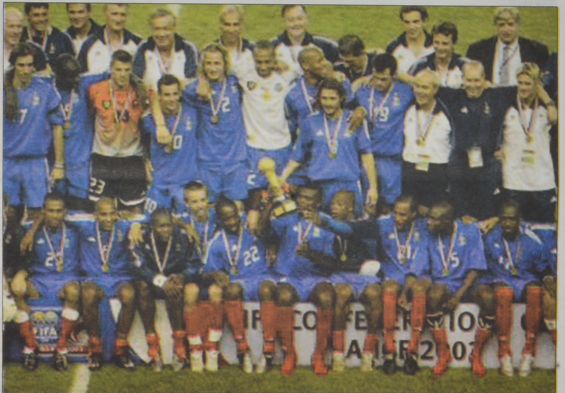
Անցեալ Կիրակի, ֆութպոլի միջ-ցամաքամասային մրցաշարի աւարտականին հիւրընկալ երկիրը՝ Ֆրանսա կոլպրն կոլով պարտութեան մարտնէց Քամերունը (1-0) եւ տիրացաւ տիրոջսին