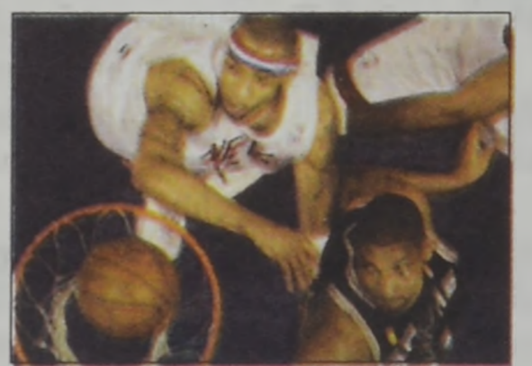
(Shahin էջ 4)