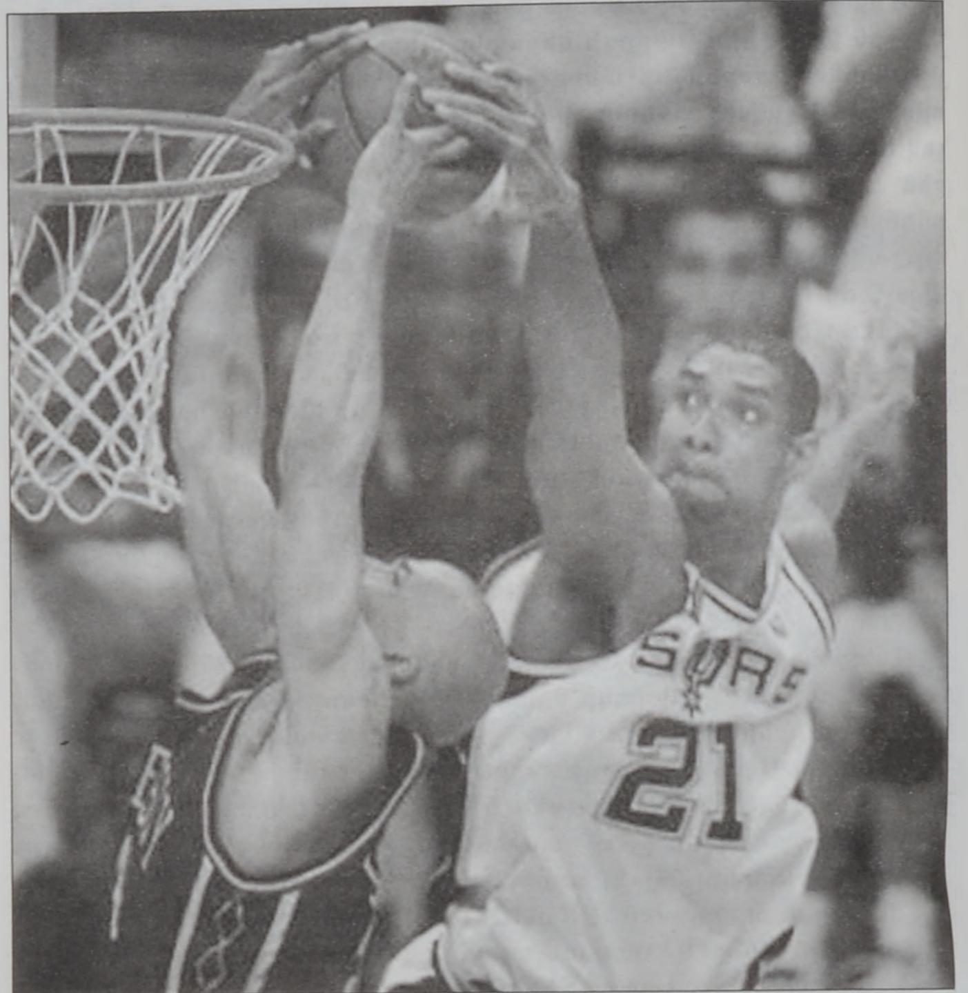
պատճառել մնացեալ խումբերուն, եթէ այս վերջինները Սփըրզի յառաջխաղացքը կասեցնելու «դարման» մը չունենան:

Նշենք, թէ երբ Սփըրզ 1999ին տիրացաւ ախոյեանութեան, Լէյքըրզի մարզիչը՝ Ֆիլ Ծէքսըն առարկեց ըսելով, թէ այդ ախոյեանութիւնը «բնական» ախոյեանութիւն մը չէր, որովհետև Սփըրզ անոր տիրացած էր միայն 50 մրցումներով, սակայն այս անգամ հարցը տարբեր է եւ Սփըրզ 100 տոկոսով արժանի է իր շահած տիտղոսին, իսկ աւելի հետաքրքրականը այն է, թէ Ռոպինսընի մեկնումով Փոփովիչ առիթը պիտի ունենայ յառաջիկայ տարեշրջանին համար իր խումբը օժտելու նոր մարզիկով մը, որ շատ հաւանաբար ըլլայ Նէթցի աստղը՝ Ծէյսըն Քիտ եւ կամ նոյնիսկ՝ Ծըրմէյն Օնիլ, իսկ անդին՝ Թոնի Փարքըրի խումբէն ներս մնալը շատ աւելի զօրաւոր պիտի դարձնէ Սփըրզը, ինչ որ կը սպառնայ յառաջիկայ եղանակին բաւական դժուարութիւն