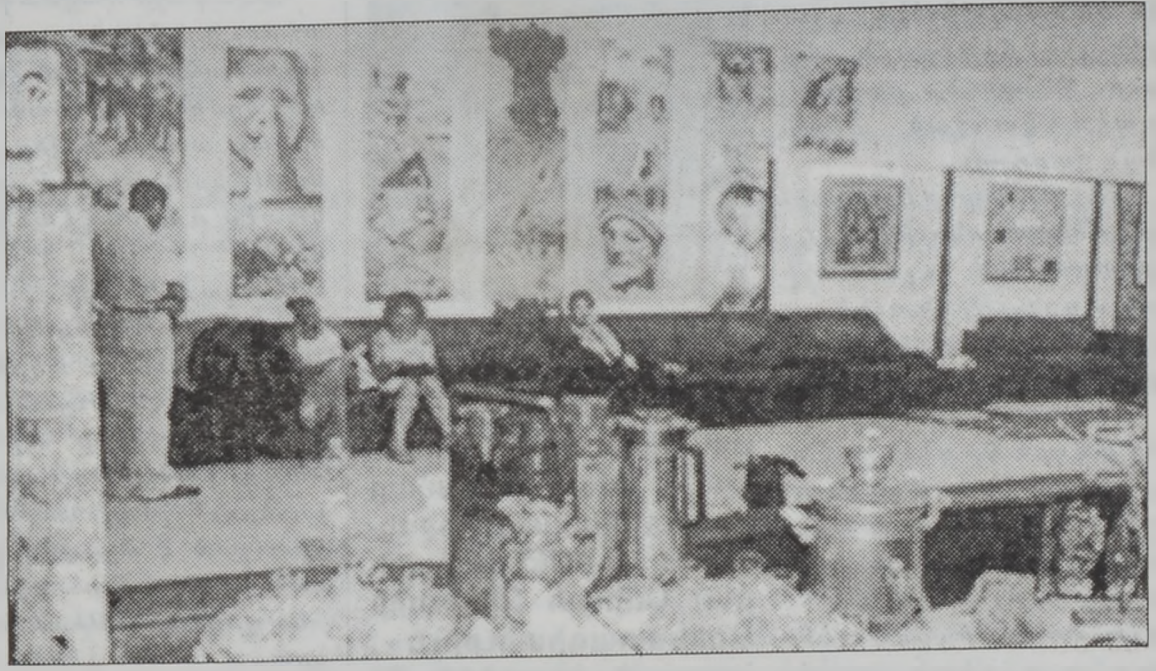
«Չէքիրաթ Իրաք» փառատօնէն անկիւն մը

Հարաւային Լիբանանի Մշակութային յանձնախումբի նախաձեռնութեամբ 23 Յունիսէն սկսեալ ԵՈՒՆԵՍԲՕ-ի ցուցարահներուն մէջ տեղի պիտի ունենայ Իրաքի նուիրուած փառատօն մը՝ «Չէքիրաթ Իրաք» խորագիրով: