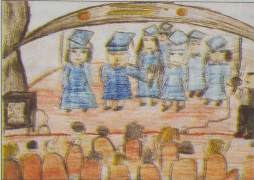
Սալի Տօնապետեան, Ե. դաս. Ա. Գասարձեան

Թերեւս վրաս խնդաք, սակայն այդպէս է: Միտքս աւելի յստակացնեմ: Արձակուրդ ան- ցընելը դժուար է, որովհետեւ լաւ արձակուրդ ունենալու համար ջանք պէտք է թափենք, որ ամէն ինչ մենք ծրագրենք եւ, ինչո՛ւ չէ, մեր ուպած ձեռով: Մինչդեռ դպրոցական օրերուն ամէն ինչ ծրագրուած մեզի կը տրուի եւ մենք միայն կը հետեւինք ու կը կատարենք: