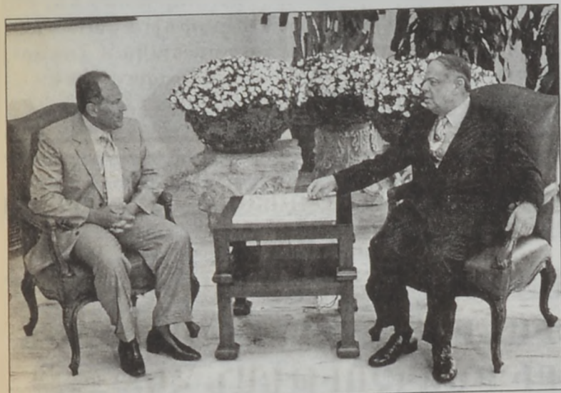
Նախագահ զոր. Էմիլ Լաճոստ երէկ շեշտեց փոխ գործակցութեան եւ հասկացողութեան անհրաժեշտութիւնը կառավարութեան ընդդիմադիրներուն եւ իշխանամէտներուն միջեւ:

Նախագահ Լաճոստ ընդգծեց, որ երկու կողմերուն ալ նպատակը պէտք է միեւնոյնը ըլլայ՝ երկրին գերագոյն շահերու ապահովումը, հեռու՝ անձնական նեղ հաշիւներէ: Ան ըսաւ, որ երբեք պիտի չըրկատի ներլիքանանեան միասնականութիւնը ամրապնդելու, գործակցելով բոլոր կողմերուն հետ: