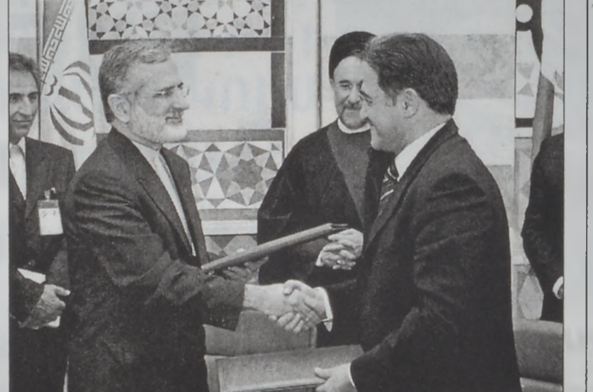
Խարազի եւ Յովհաննէան կը փոխանակեն կցըրուած համաձայնագիրները՝ Երիտասարդութեան եւ մարմնակրթութեան մարզին մէջ

տանկան կապը իմամ Մուսա Սաւրբի հետ եւ ընդգծեց, որ իմամ Սաւրբի առեւանգումին հարցով լուծում չկայ տակաւին, հակառակ անոր, որ Իրան ամէն շանք ի գործ դրած է նշեալ հարցին լուծման գծով: Պըրրի աւելցուց, որ համաձայնութիւն գոյացած է առեւանգուած իմամ Սաւրբի հարցը միասնաբար հետապնդելու: Ան դիտել տուաւ, որ