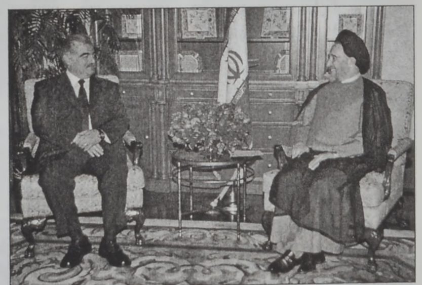
Շարիհի եւ Խաթեմի

Ապա նախագահ Խաթեմի իր կեցութեան վայրին մէջ ընդունեց խորհրդարանի նախագահ Նեպիհ Պըրրին, որուն հետ 40 վայրկեան տեւողութեամբ հանդիպում մը