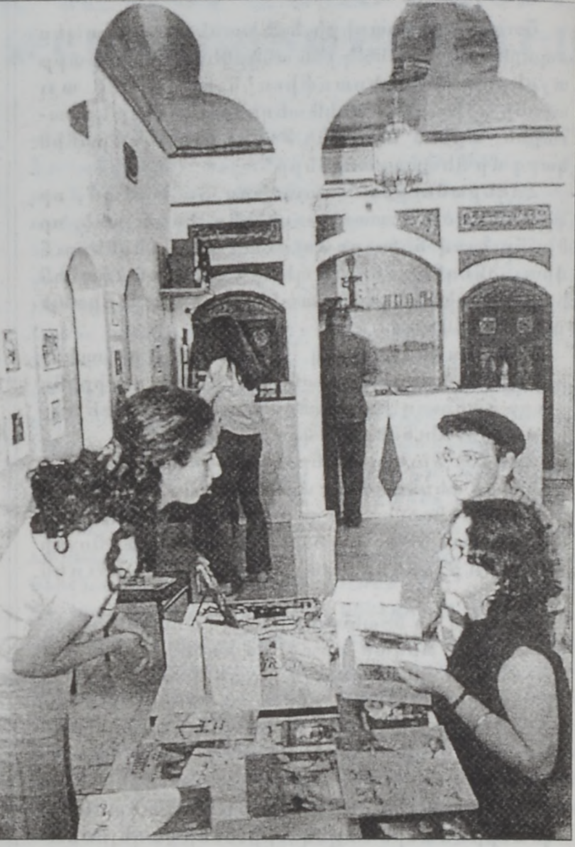
6:00ին տեղի պիտի ունենայ գրական-թատերական երեկոյ մը, որուն ընթացքին պիտի ներկայացուի արաբ անգլիագիր վիպագիր ժառ Ալ Հաժի վերջին վէպը՝ «Տըլէս մայկրէյըն»ը: Ուսումնա Պարտաուիլի դեկամբրներէն, երեկոյեան արհեստավարժ ինք շաբթի, 14 Մայիսի երեկոյեան ժամը

Պաղեստինցի ժողովուրդին մշակութային բազմատեսակ արտայայտութիւնները իրանանեան հանրութեան ներկայացրնող նախաձեռնութիւն մը տեղի կ'ունենայ «Պէյրութ» քառօրյա արահիյն մէջ: Անմիջապէս նշենք, որ այս նախաձեռնութիւնը թէեւ կը կրէ «Պաղեստինը» նոր շարժապատկերին մէջ» խորագիրը եւ մեծ մասամբ նուիրուած է պաղեստինեան ժամանակակից շարժապատկերին, բայց եւ այնպէս մշակութային այս իրադարձութիւնը տեղ յատկացուած է նաեւ պաղեստինեան նոր հրատարակութիւններու, ինչպէս նաեւ երիտասարդ արուեստագէտներու գծանկարներուն, զետեղման արուեստի գործերուն ու ձեռնարկի աշխատանքներու ցուցահանդէս-վաճառք մը, կոր կարելի է այցելել մինչեւ Հինգշաբթի, 15 Մայիս, առաւօտեան ժամը 11:00էն մինչեւ ուշ գիշեր: