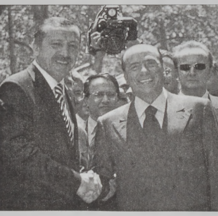
Էրտողան եւ Պերլուսենի

ԱՆԳԱՐԱ, 12 (ԱՅՓ).- Իտալիա իր կարելին պիտի ընէ Եւրոպական Միութեան ա ն դ ա մ ա կ ց ե լ ու թ ու ը ք ի յ ձ ձ գ եր ու ն օ ժ ա ն դ ա կ ե լ ու հ ա մ ար, խ ո ս տ ա ց ա ժ է Ի տ ա յ ի յ վ ար չ ա պ ե տ Ս ի ղ Վ ի Պ եր լ ու ք ո յ ի, Երկուշաբթի օր: