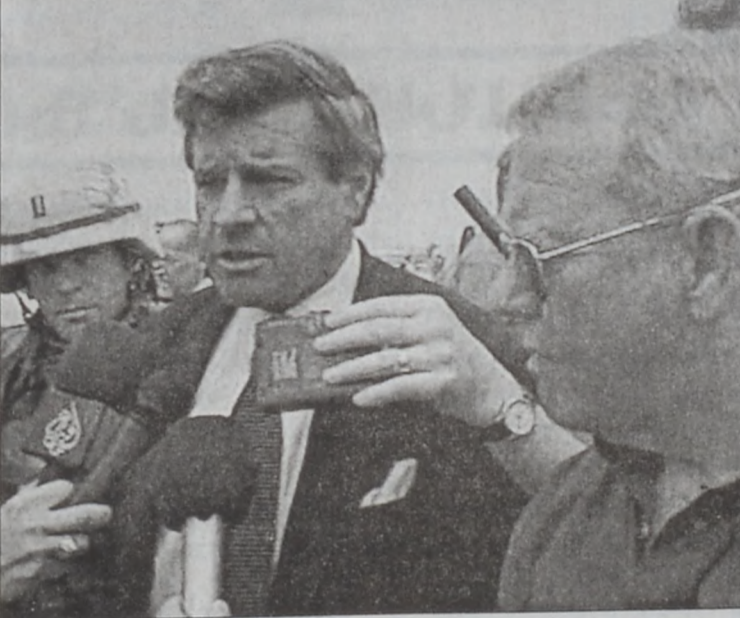
Պրեմըր եւ Կարնըր (աջից)

Յետպատերազմեան Իրաքի ամերիկացի նոր ղեկավարը՝ Փոլ Պրեմըր երէկ Պաղտատ մեկնեցաւ ստանձնելու համար ղեկը տագնապահար երկրի մը, որ կը գահավիժի դէպի քոսոս: Պաղտատ ուղղուելէ առաջ, Պրեմըր նախ այցելեց Պասրա, ուր ըսաւ, թէ հիւսնայի մարտահրաւէր մըն է իրաքի ժողովուրդին օժանդակելու աշխատանքը, որ կ'ենթադրէ վերականգնել երկիրը, ինչպէս նաեւ՝ ժողովրդավար ընդունելի վարչակարգ մը հաստատել: Պրեմըր, որ կը փոխարինէ Ճէյ Կարնըրը, աւելցուց, որ հպարտ է անոր տարած աշխատանքով, գործուած է անցնող ժամի մը շարաքիններուն ընթացքին: Իրաքի մէջ ամերիկեան քաղաքային իշխանութիւնը յաճախ կը քննադատուի, որովհետեւ վերաշինութեան գործընթացը դանդաղ կ'ընթանայ: Իրաքիներէն շատեր տակաւին ջուրէ եւ ելեկտրականութենէ զրկուած են, աղբերը կուտակուած կը մնան փողոցներուն մէջ, իսկ զինեալ խմբակներ կը շարունակեն սարսափեցնել բնակիչները: Ամերիկեան սպայակոյտի պետ զօր. Ռիչըրտ Մայլըրը, որ Պրեմըրի եւ Կարնըրի հետ Քուէյթ փամանած էր երէկ, շեշտեց որ սպահնութիւնը եւ կարգը ու կարգը անոր երկու գահակները՝ Ուսայ եւ Քուսայ ողջ են եւ տակաւին իրաքեան հողերու վրայ կը գտնուին: Փալապի աւելցուց, որ ըստ հասած տեղեկութիւններու Սատտամ ընկերակիր կամ Պասս Կուսակցութեան հետեւորդները իշխանութեան պիտի չվերջադառնան: Ան ըսաւ նաեւ, որ Սատտամի հաւատարմ ըրողութեանը ու շարժումը: