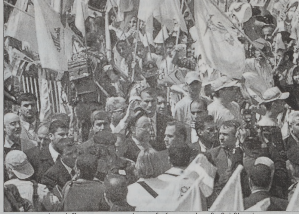
Խաթեմի շրջապատուած բազմահազար լիբանանցիներով

րէն Կոր. Էտուար Մանուրի, բանակի գաղտնի սպասարկութեան տնօրէն Կոր. Ռեմոն Ապրի, Լեռնալիբանանի նահանգապետ Եսաֆույ Սարրաֆի, ինչպէս նաեւ լիբանանցի բարձրաստիճան այլ պաշտօնատարներու կողմէ: