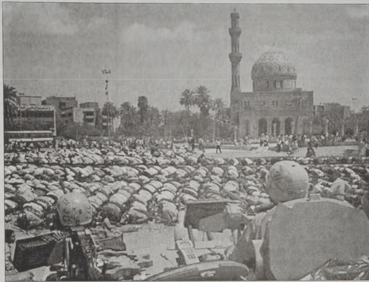
Իրաքցիք Պաղատաի կեդրոնը հաւաքաբար կ'աղօթեն՝ ամերիկեան բանակի խիստ հսկողութեան ներքեւ...

Միացեալ Նահանգներ ժողովրդավար ապագայ մը խոստացան Իրաքի՝ Պաղատաի մէջ գումարուող խորհրդաժողովի մը ընթացքին, որուն կը մասնակցին Իրաքեան ընդդիմադիր եւ քաղաքական այլ շարժումներու հարիւրաւոր ներկայացուցիչներ: Խորհրդաժողովին նպատակն է նախապատրաստական քայլեր որդեգրել կազմելու համար Իրաքեան կառավարութիւնը: