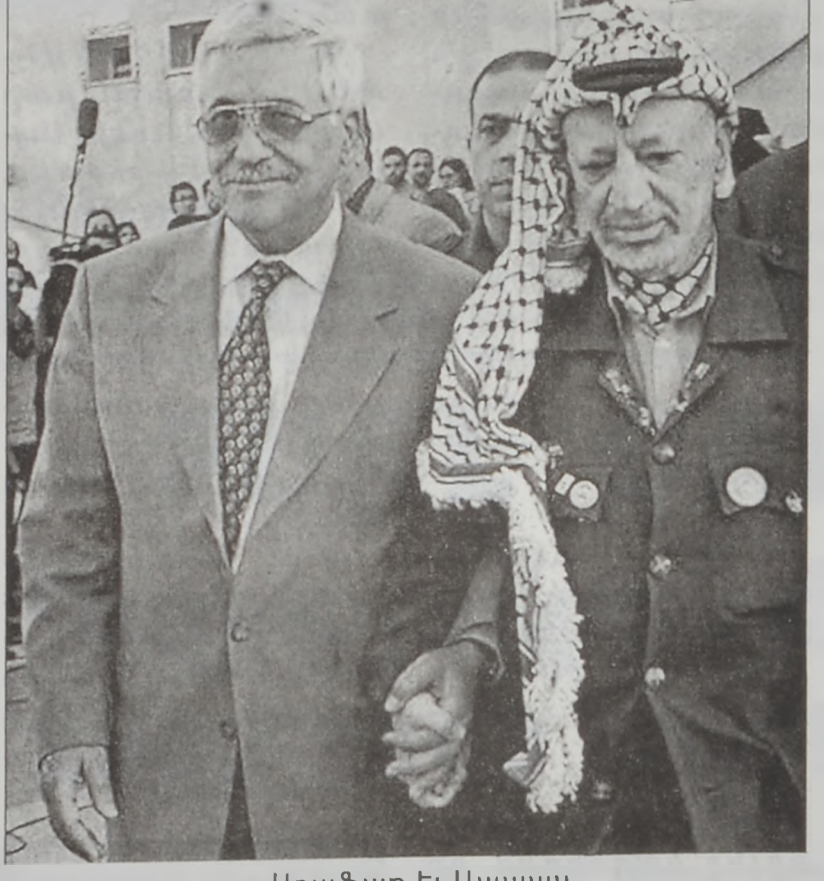
Արաֆատ և Ապպաս

շացուցած էր պաղեստինեան նոր կառավարութիւնը ծայրայեղականներու դէմ պատերազմ հռչակելէ: Միւս կողմէ, Արաֆատ եւ անոր ղեկավարած Ֆաթի շարժումը խորհրդարանին մէջ գորակից պիտի կանգնին Ապպասի կառավարութեան: Կը նախատեսուի, որ արմատական շարժումներ քուն չտան նոր կառավարութեան: